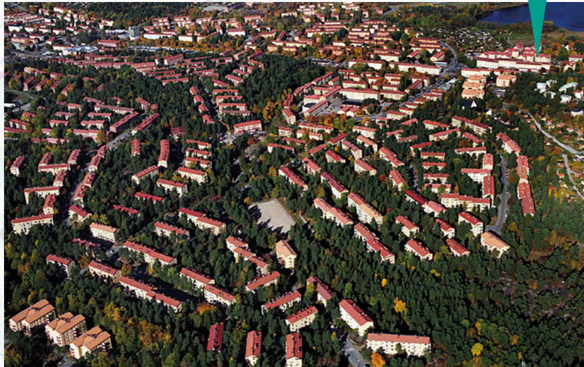
Flygfoto över Åkeslund, Olovslund och Abrahamsberg.

Välkommen till Bromma-bubblan! Den kan vara svår att spräcka! Här finns mycket att se och i denna stadsvandring kommer vi täcka allt från gamla historiska monument, till modern konst och berättelser bakom välkända Brommaplatser! Guiden är gjord av sommarjobbade ungdomar som bor i området.