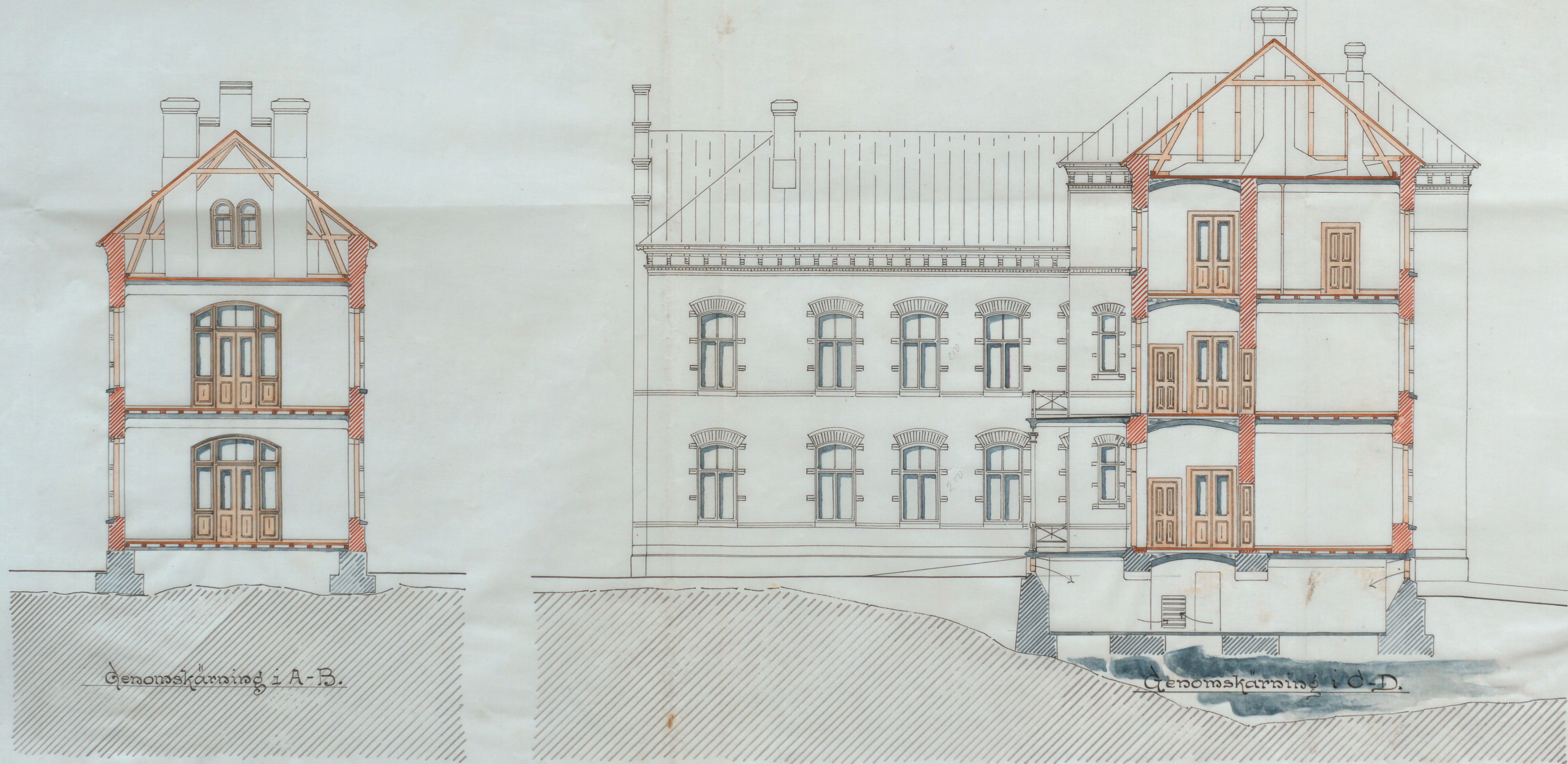
Genomskärning i A-B.

Stockholm den 7 de Juli 1897 August Medel