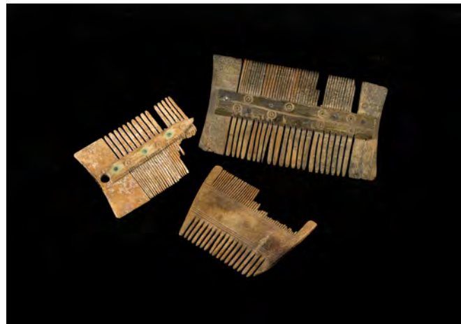
Alla hade problem med löss under medeltiden. Daglig avlusning hörde till god hygien och var framför allt en kvinnlig syssla.