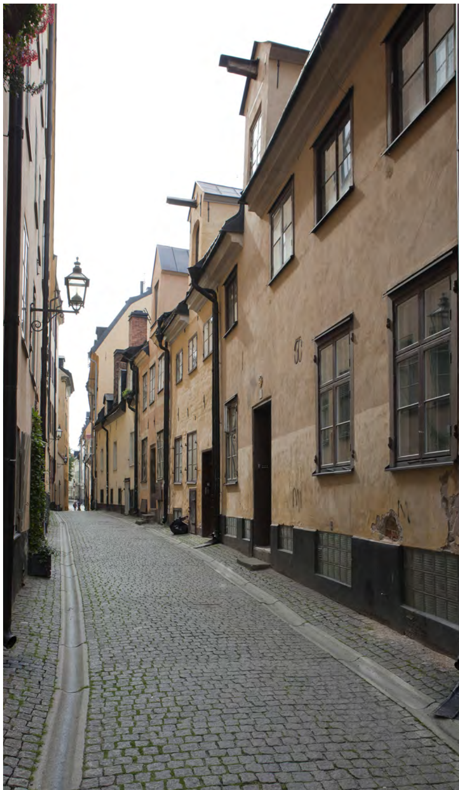
Prästgatan slingrar sig fortfarande fram precis som på medeltiden. De små husen har kvar sin medeltida höjd.

Torget var stadens hjärta. Här hämtade kvinnorna sitt vatten och här kunde man få ett arbete för dagen. Men här utbröt också häftiga ordväxlingar och slagsmål. Därför gick stadens invånare