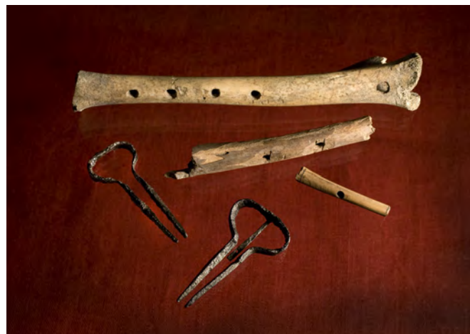
Olika medeltida musikinstrument; mungigor och benflöjter.

titt som tätt till rådstugan för att delta i rättegångar, ibland som kätande och ibland som svarande. Det slutade ofta med böter för båda parterna.