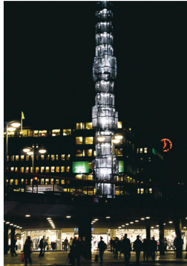
VAD HETER DEN EGENTLIGEN? Sergels torg och glaspinnen.