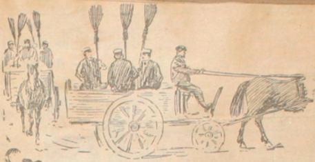
På väg till sopningen.

let mindre vanliga af mer eller mindre litet klädda åskådare i föresten. I allmänhet åtagmlade dessa åskådare och åskådariorer en tydlig tillfredsställelse med det renhållningsarbetet.