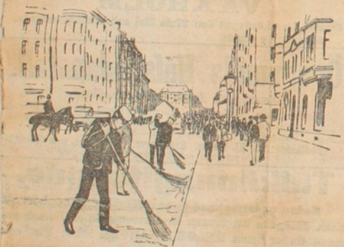
Nopning under polisberäkning.

I onsdags natt, när dagen började gry i öster, sandades en femton ynglingar stark utfdelning af Stockholms nya frivilliga säkerhetsvakt på Normalns renhållningstation. Denna är belägen i yttersta ändan af Vasastaden, intill de mestadels ofullbordade byggnader med berginallar mellan husanderna i stället för gator, som skola bilda den blifvande Birkastaden.