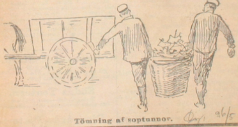
Tömning af sopnunnor.