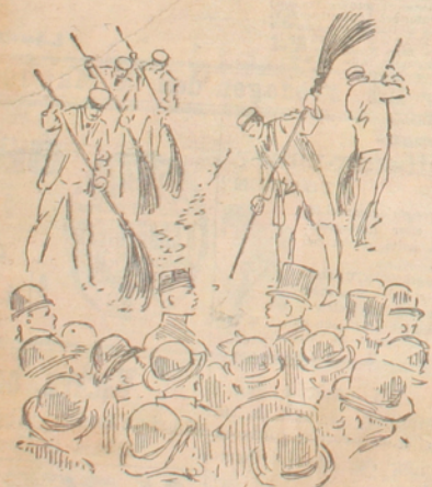
En socialpolitisk diskussion på Odengatan.