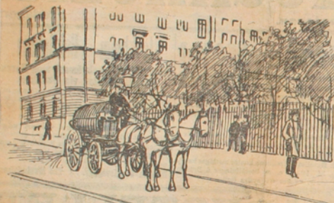
Studenterna på väntan.