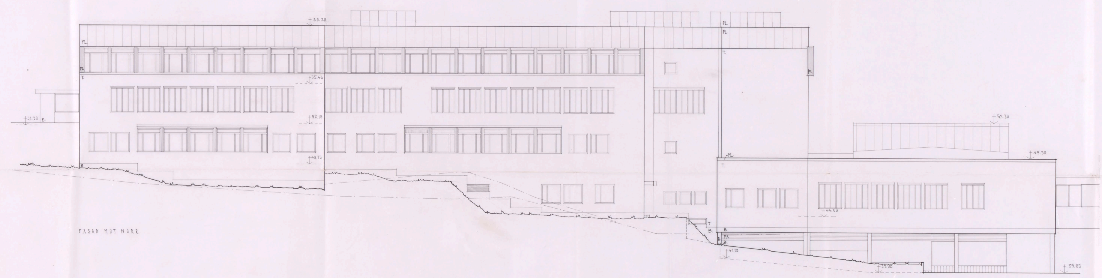
FASAD MOT NÖRRE

INOM DENNA STRÄCKA HAR HÄNSYN EJ TAGITS TILL FÄRGAERNAS INREDES VINKEL- ÄNDING.