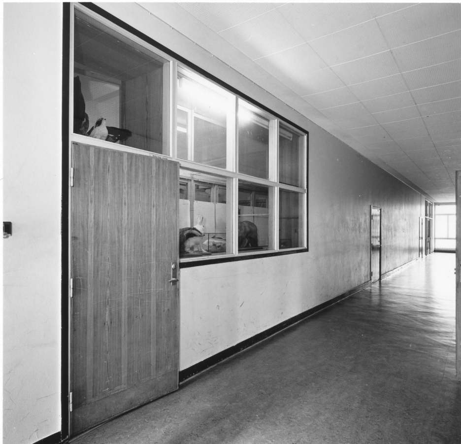
S92-0591-2 Korridor med skyltskåp.