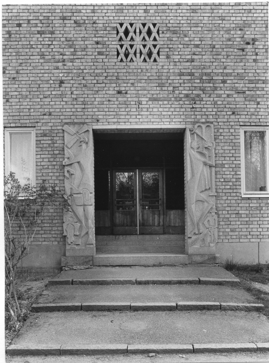
S92-0257-34 Detalj av entré.