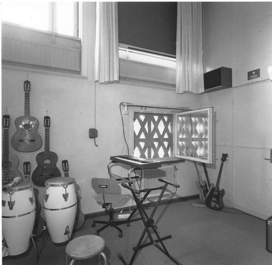
S92-0255-12 Fönster i musiksalen.