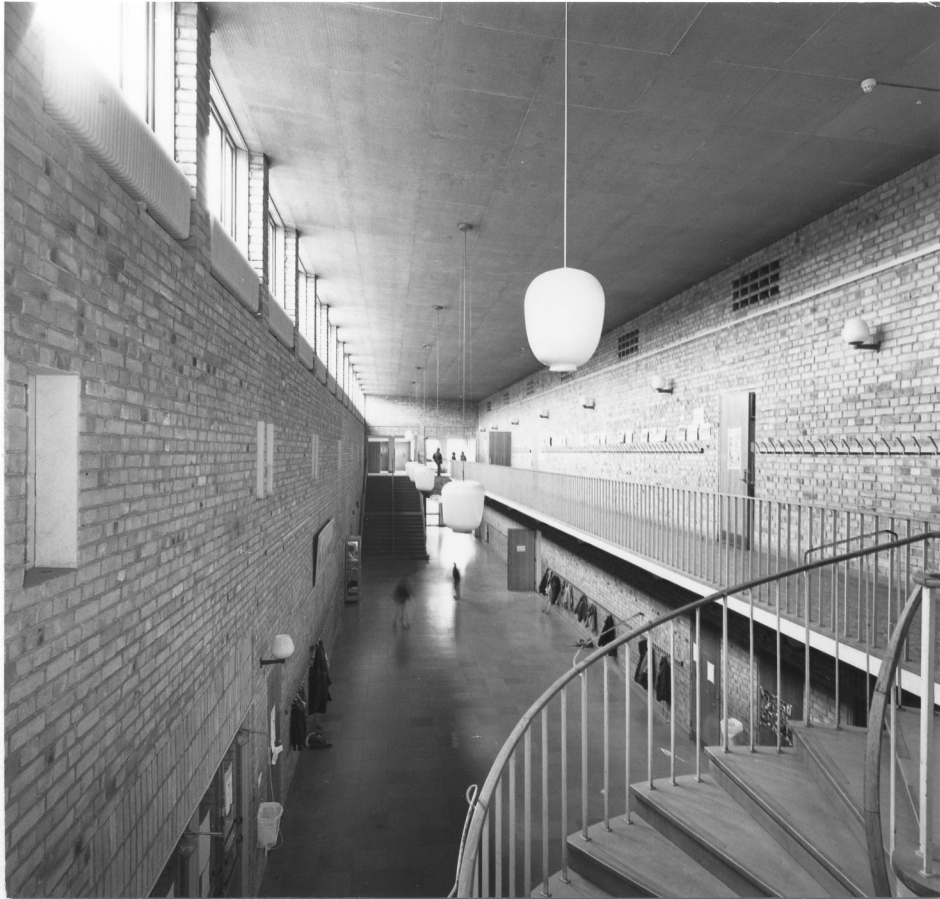
S92-0256- 10 Ljushall.