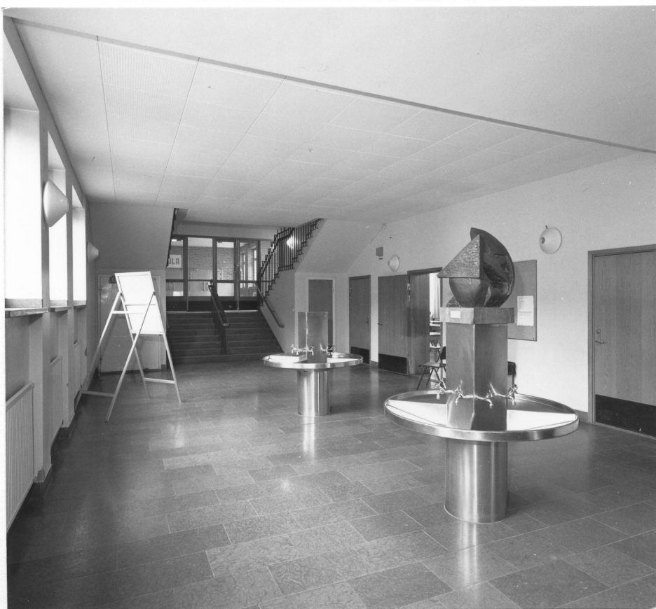
S92-0179-2 Entré vid matsalen.