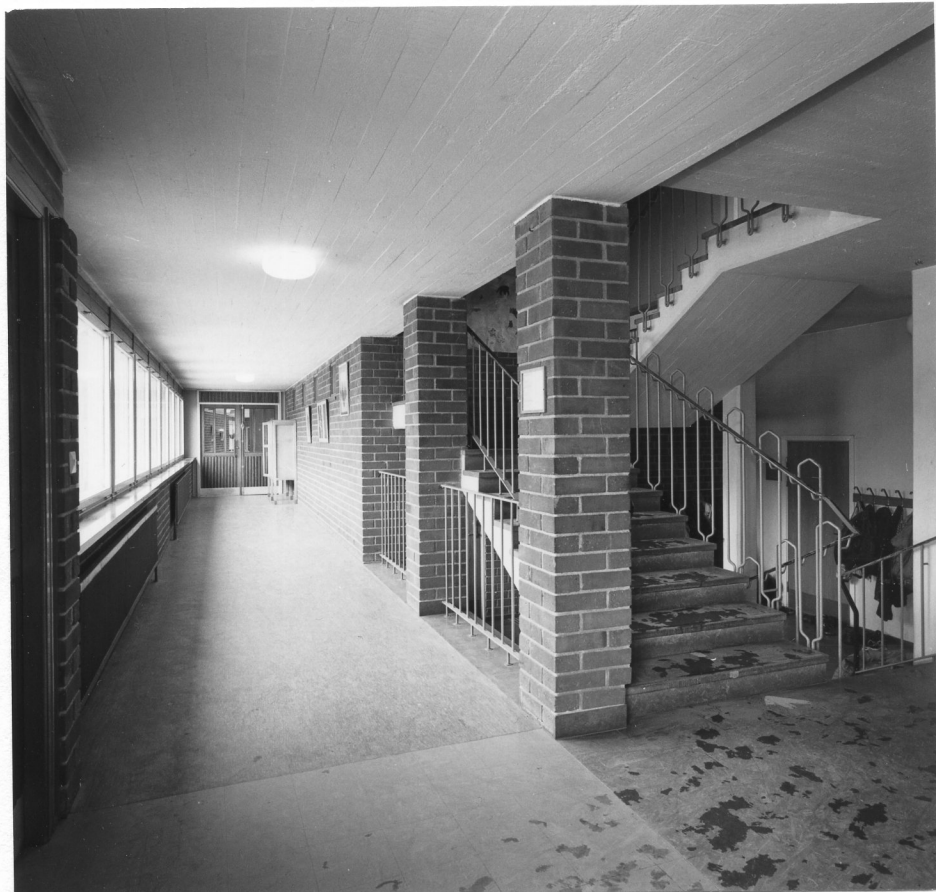
S92-0178-8 Korridor och trapphus.