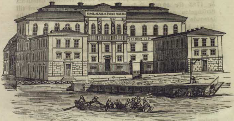
Fria Konsternas Akademi.

demiens lokal en prydnad för hufvudstaden. Byggnaden innehåller rum för de åtskilliga skolorne samt expositionssalar och sessions-sal, hvarjemte, enligt stadgarnes föreskrift, boningsrum finnas för direktören, sekreteraren och betjening. Öfriga lägenheter, såsom boningsrum och salubodar, uthyras för akademiens räkning. De på byggnadens vackra façad anbringade statyer af målare- och bildhuggarekonsten samt arkitekturen och gravyren äro modellerade af prof. Qvarnström.