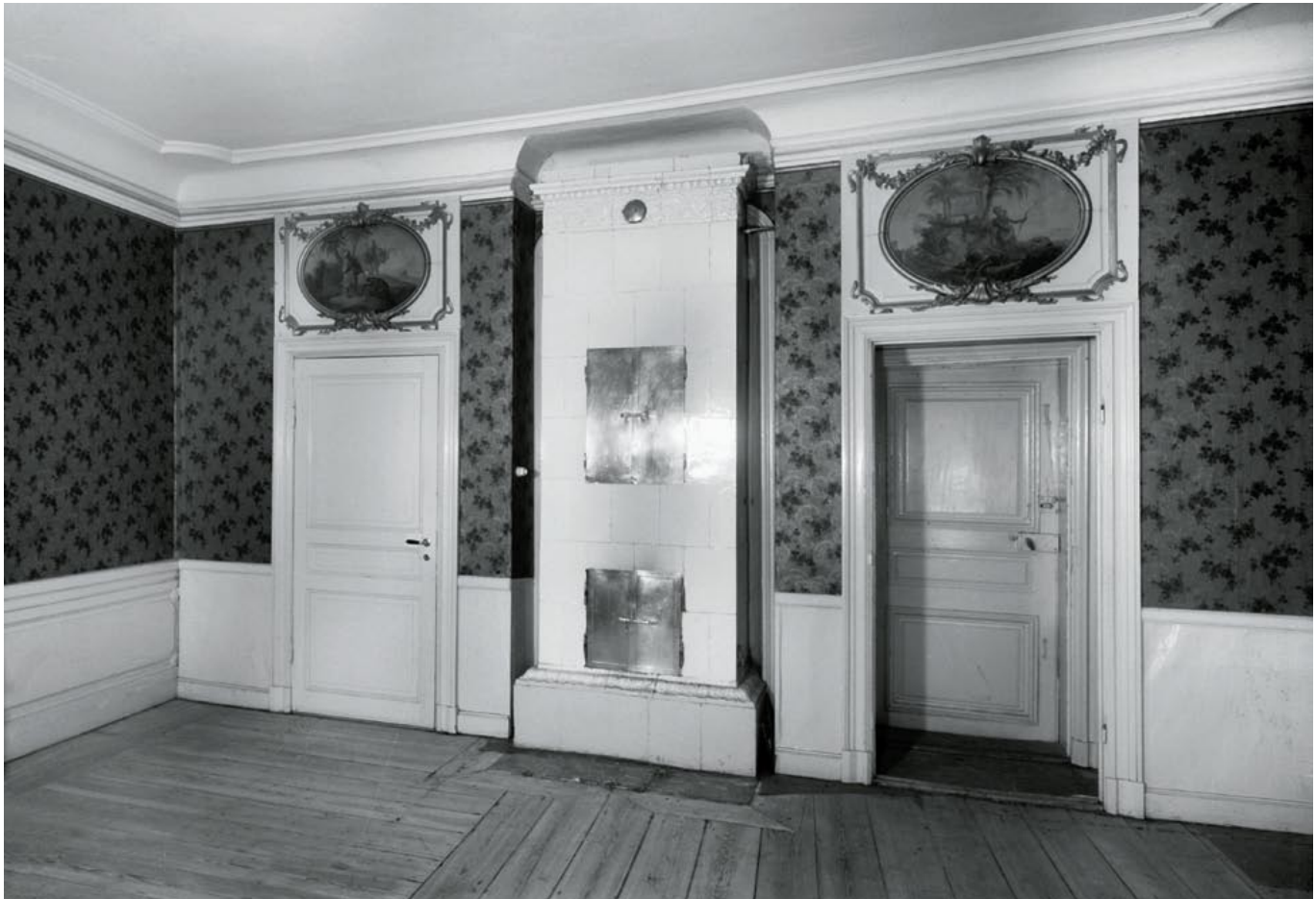
Salen på första våningen i Moriens hus vid Hornsgatan 10, med allegoriska dörröverstycken föreställande Afrika och Amerika efter förlagor av den italienske konstnären Jacopo Amigoni.

enstaka konstkännare som visste att uppskatta den. 1736 sökte Carl Gustaf Tessin upp den utanför Italien nästan okände Tiepolo, en av Amigonis förebilder och inspirationskällor. Tessin underhandlade med Tiepolo om att smycka Stockholms slott, men tyvärr strandade förhandlingarna eftersom man inte kunde betala det arvode som Tiepolo begärde. Men Tessin fick i alla fall med sig ett par målningar av hans hand hem till Sverige. Tiepolo var, liksom Amigoni, elev till Gregorio Lazzarini, men han tycks ha inspirerats mer av t.ex. Sebastiano Ricci än av sin lärare. Tiepolo