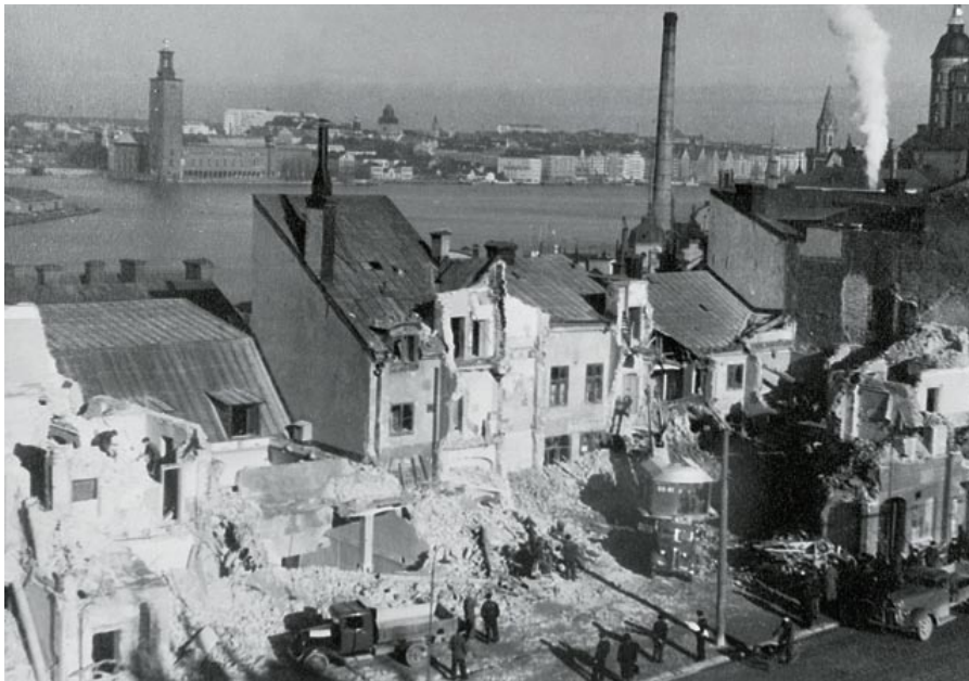
Kvarteret Överkikaren på Södermalm vid rivningen 1939.

»I slutet av 1930-talet revs ett antal hus vid Hornsgatan för att ge plats åt Söderleden. Med husen försvann för alltid ett stycke av stadens 1700-talshistoria. Bland de byggnader som revs fanns Moriens hus på Hornsgatan 10.«