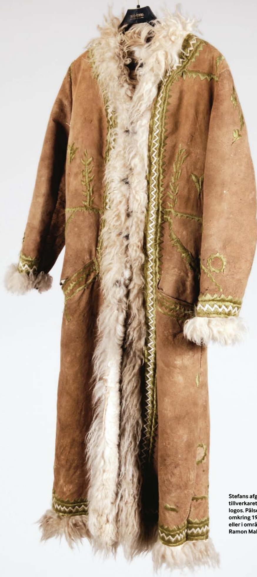
Stefans afghanpäls har inte några tillverkaretketter, märken eller logos. Pälsen förmodas vara sydd omkring 1970 i Afghanistan, Indien eller i områdena däromkring.