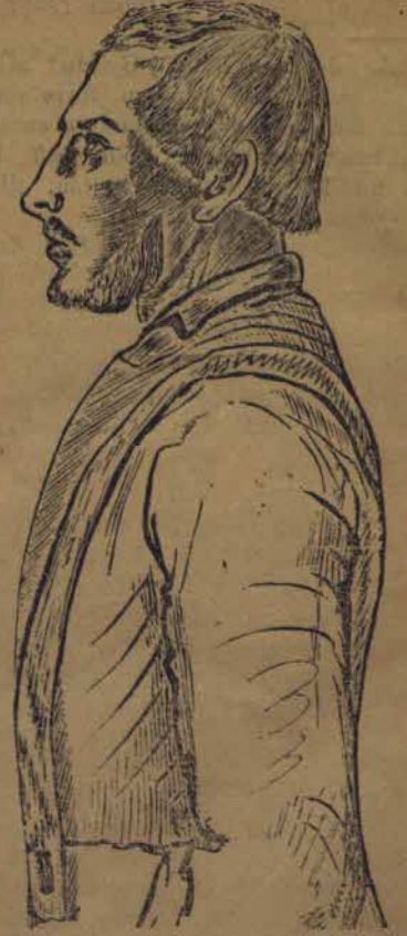
STOCKHOLM, ROSENSTRÖMS boktryckeri, 1874.