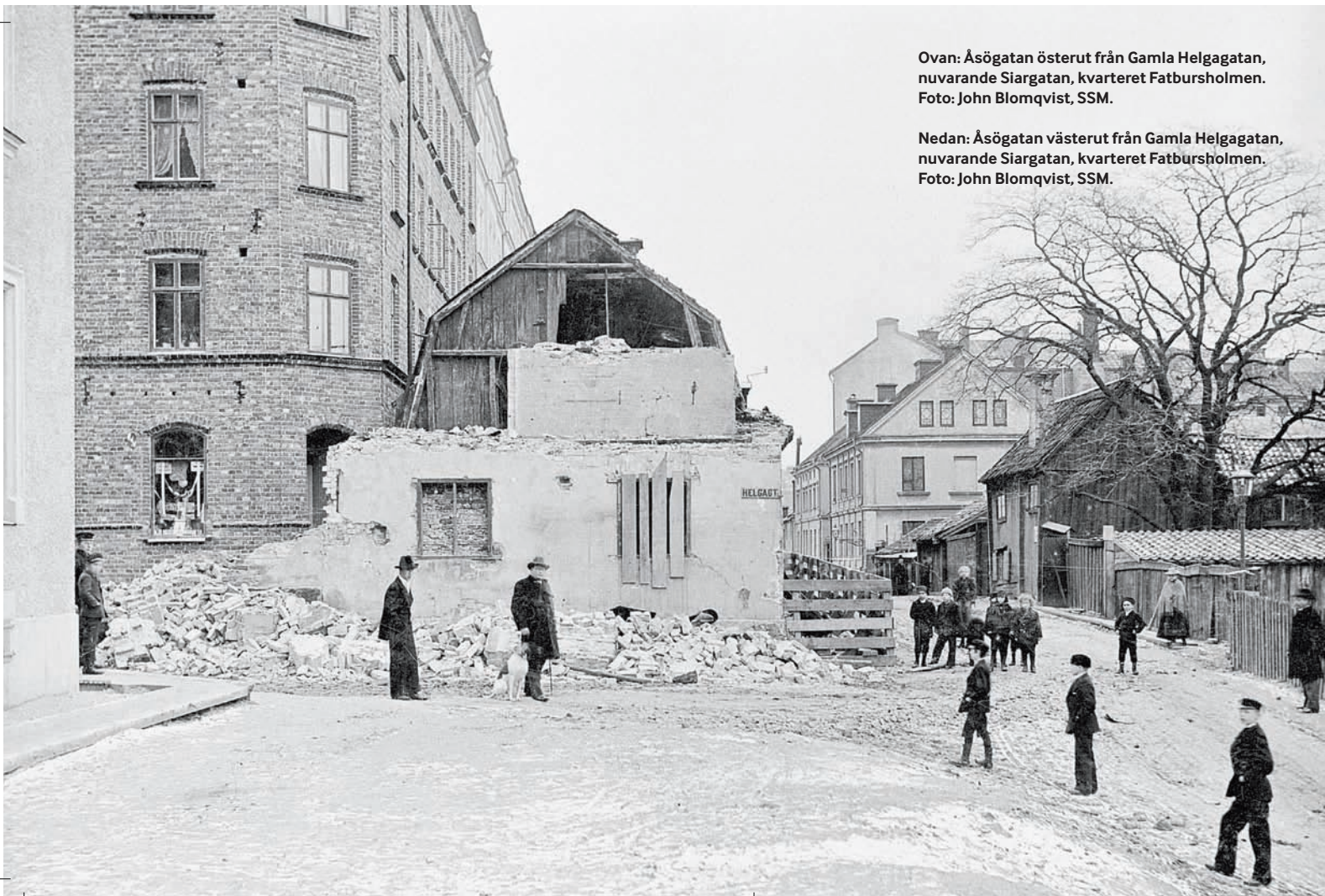
Nedan: Åsögatan västerut från Gamla Helgagatan, nuvarande Siargatan, kvarteret Fatbursholmen.