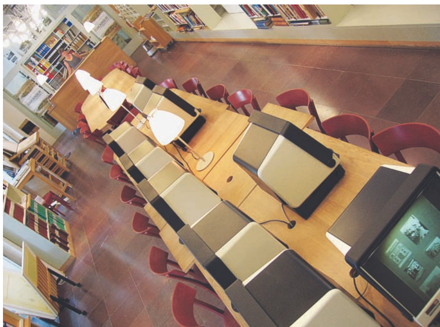
Faktarummet, Stockholms stadsmuseum.