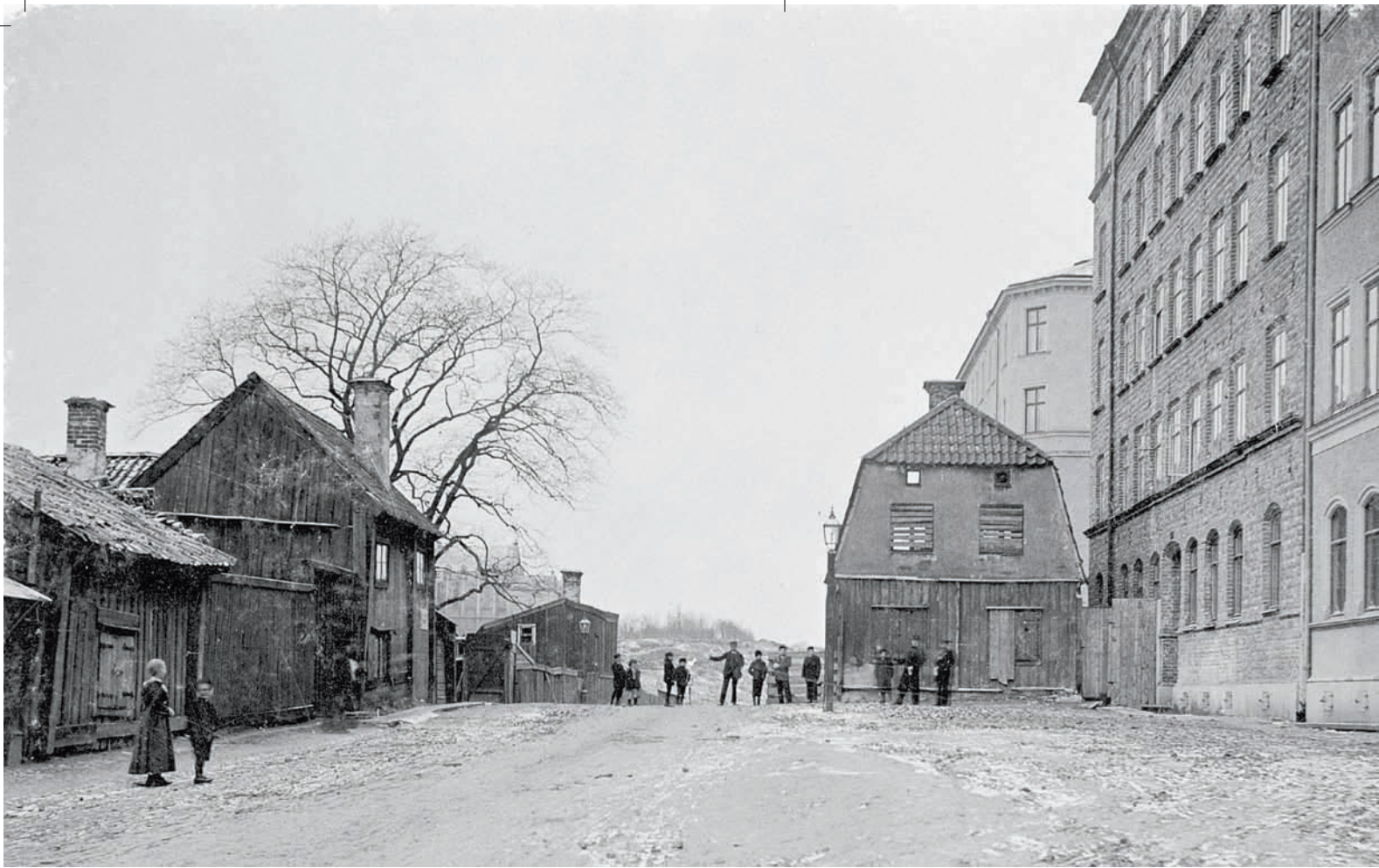
Ovan: Åsögatan österut från Gamla Helgagatan, nuvarande Siargatan, kvarteret Fatbursholmen.