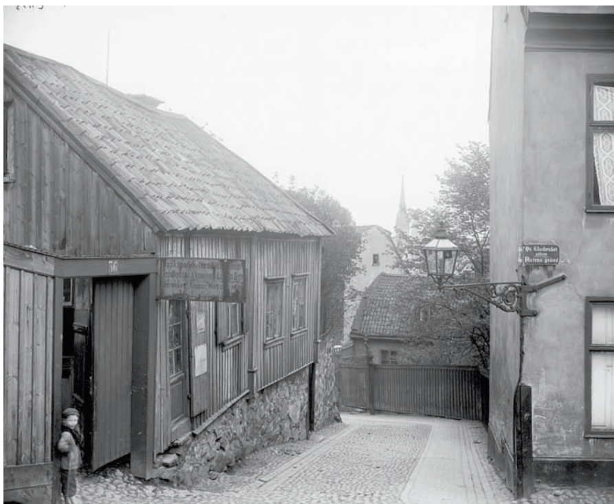
Stora Glasbruksgatan från Rutensgränd 1902.

hemma. Men nu har jag ett ordnat register. Underlag till detta har jag hittat i böckerna Stockholms gatunamn och Stockholm från A till Ö .