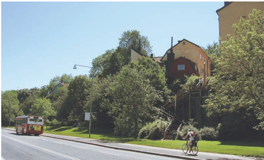
Ovan: Nytorgsgatan. Foto: Oscar Heimer, 1906, SSM.