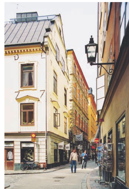
Lydert Lang uppförde hörnhuset 1627 vid Västerlånggatan och Funcckens gränd, vilket kan utläsas av ankarslutarna. Byggnadens volym, takfall och gavelröste står fortfarande oförändrade, till skillnad mot fasaderna. De stod ursprungligen oputsade men rödmålade som kontrast till gavelrösternas dekor i gotländsk sandsten.

När husets fasad mot Västerlånggatan renoverades 1995 knackades endast