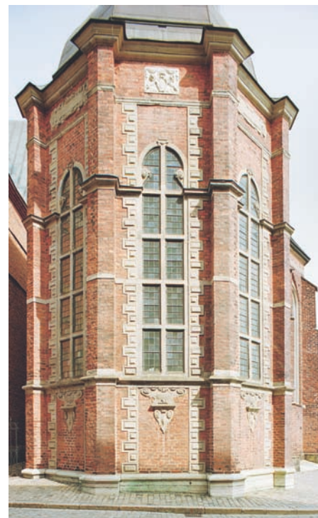
Detaljbild av gustavianska gravkoret med omsorgsfullt murade och välfogade tegelytor. Dessa var ursprungligen rödfärgade som kontrast till all huggen dekor i gotländsk sandsten, vilken troligen var målade i gråvit oljefärg. De blyspröjsade fönstren med sina stormjäm förstärker den genuina 1600-talskänslan.

Gravkorets exteriör är lättillgänglig för alla och där kan man beundra murtekniken i sin alltjämt ursprungliga form. Fasaderna är helt ornerade i tidens anda, med synnerligen välmurade tegelytor samt omsorgsfullt slätstrukna och ritsade fogar. Även här blev den oputsade tegelytan rödfärgad och fogarna försågs därefter med tunt målade vita foglinjer. Fasaderna smyckas av dekorationselement som är huggna i gotländsk sandsten och ursprungligen bör ha varit målade med gråvit oljefärg, som kontrast till det röda. Ansvarig byggmästare var Jost Henne, en sten-