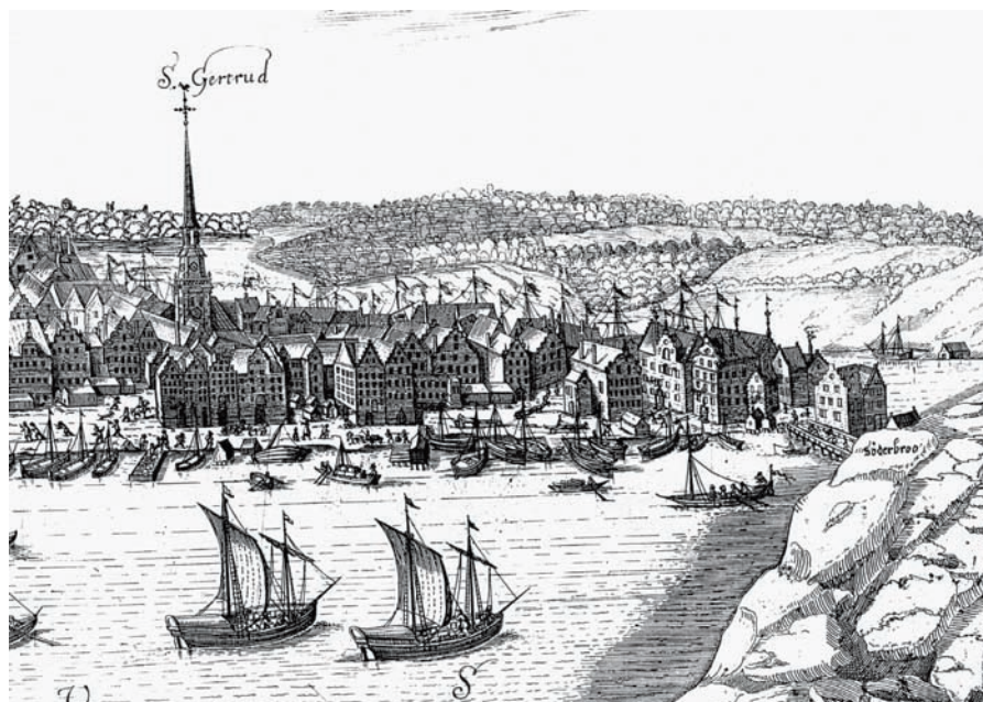
Stadsholmen sedd från Skinnarviksberget visar i detta utsnitt bland annat de tidsenligt «moderna» hustyperna längs Västerlånggatan, mellan Järntorget och Tyska kyrkan. Kopparstick av S. Vogel, 1647.

randbebyggelsens karaktär, kan man få av de fåtaliga samtida avbildningar som finns. De bästa uppgifterna får man om