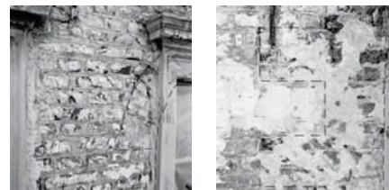
Västerlånggatan 75. I murpelaren mellan fönstren på våning 3 tr. ser man den välmurade tegelytan från tidigt 1600-tal, med slätstrukna och ritsade fogar. Valvbågen över fönstret är murat med tunna holländska tegel.

I det stora och långsmala kvarteret Typhon, begränsat av Västerlånggatan,