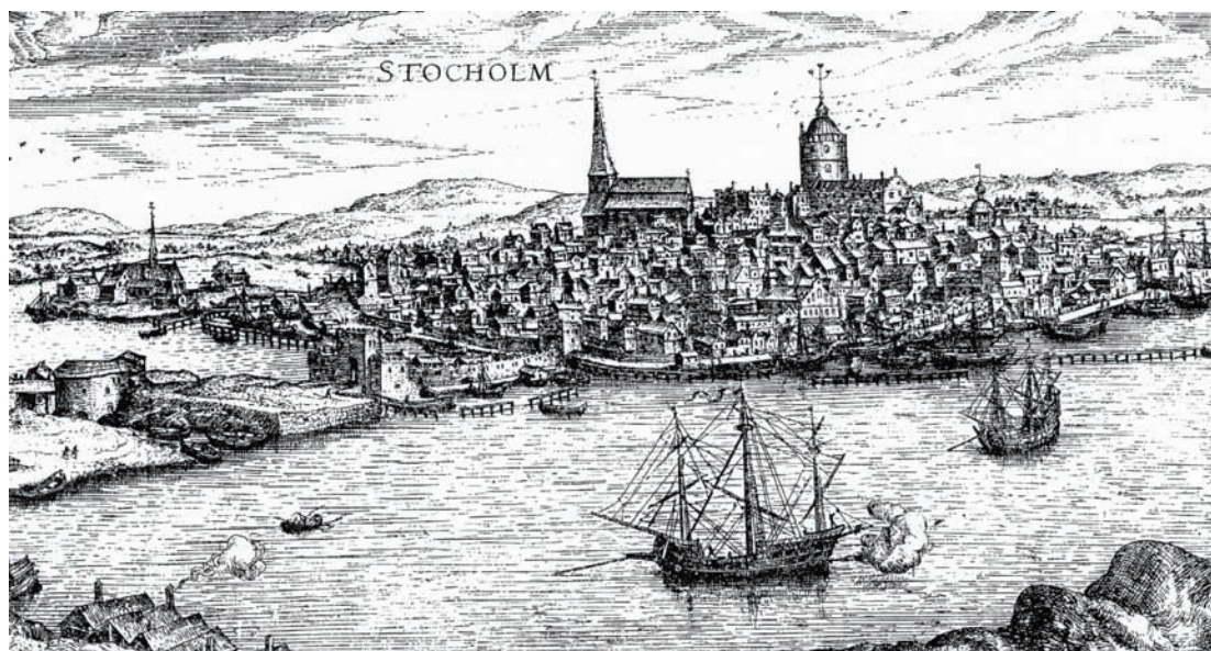
På Hogenbergs vy över Stockholm från 1570-talet anar man fortfarande en relativt småskalig stadsbebyggelse innanför den yngre stadsmuren med sina befästningstorn. Utsnitt av kopparstick av Hogenberg efter H. Scholeus teckning.

F rågorna blir många när man funderar över hur det gick till när Stockholm från 1620-talet ändrades från att vara en senmedeltida småstad i Europas utkant till att bli en huvudstad, värdig den nyblivna stormakten Sverige. Vilka kom med impulserna? När satte förvandlingen igång? Hur fort gick det? Hur genomfördes den? När man letar efter arkivaliska uppgifter om husen i stadens Tänkeböcker (protokollsböcker från stadens rådhus), och från 1600-talets förra hälft bland annat i «Brända boken» 1635-47, får man i bästa fall knapphändiga uppgifter om att det byggdes eller fanns enstaka stenhus på tomter där, som regel, endast tomtmåten anges. Ibland finner man uppgifter som att grannar klagade på störande grundläggningsarbeten och på att husbyggen förtog dagsljuset i deras bostäder, men knappast någon information lämnas om hur husen faktiskt såg ut. En viss uppfattning om stadens utseende, och