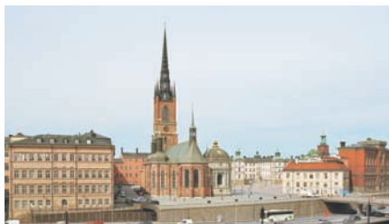
Riddarholmen sedd från Gamla stan. Det gustavianska gravkoret som ses på korets södra sida var det första som byggdes 1629–1634 och det följdes inom ett par årtionden av flera andra, också byggda i tegel, med tidsenlig dekor.

Exakt när alla nya hus längs Stora och Lilla Nygatan slutligen hopbyggts kvartervis, från Kornhamnstorg upp till Riddarhustorget, är svårt att säga. En antydning får man av kopparsticket med Karl X Gustavs begravningståg från år 1660. Där avbildas bland annat fastigheterna på Stora Nygatans västra sida som fond till begravningsståget. Även om sticket i vissa delar överdriver och försköner verkligheten kan man konstatera att nästan alla hus avbildas med stora tidstypiska takfall, med gavelrösten och hissappar, rejält ornerade fasader samt stora skulpterade portaler – om de sistnämnda inte döljs bakom sorgfanor. Ett fåtal tomter visas obebyggda, vilket också arkivaliskt kan beläggas. I verkligheten förefaller det som om de sista fastigheterna att regleras fasadmässigt är de som ligger på östra sidan av Stora Nygatan, inom den