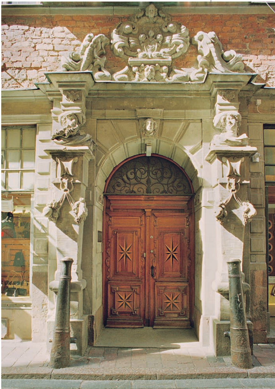
Portalen till von der Lindeska huset, Västerlånggatan 68, tycks ha behållit sina huvuddrag från omkring 1630. År 1907 ska gamla tjocka oljefärgslager ha avlägsnats och senare sägs skulptören Christian Eriksson ha överhuggit vissa stenpartier. År 1946 var särskilt sandstenen i portalens överdel så skadad att stora delar av brosk- och växtornamentiken ersattes av lika former gjorda i konststen. På 1980-talet var det dags för en ny översyn och konservering av sandstenen i hela gatufasaden.

som Mälaren. Längs de smala gränderna i norr och söder fanns äkta sandstensdetaljer endast intill själva hushörnen, medan den övriga «stensdekoren» i grändfasaderna ersattes av gråmålad stenimitation av tjockt påslaget murbruk. Erik Larsson ska ha hämtat hantverkare av olika slag från Tyskland och även om den ansvarige byggmästaren inte är känd, måste det lyckade resultatet betraktas som stilbildande.