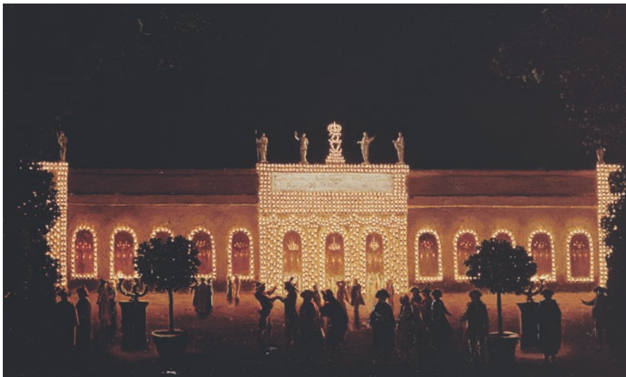
«Vauxhallen i Kungsträdgården.» Vauxhallen/orangeriet illuminerad år 1791 med anledning av Kungl. Majts lyckliga återkomst från utländska hälsosovatten, konstnär: Pehr Hilleström.