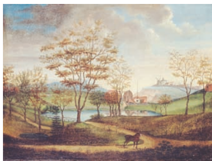
«Utsikt mot Observatoriehöjden.1800-talets början.» Observatoriet med sitt karaktäristiska torn som fick sin kupol 1877, konstnär: okänd.