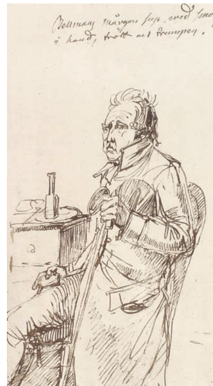
«Bellmans mårgon sup. med smörgås i hand, trött och trumpen.» Pennteckning av J. T. Sergel.

1 AUGUSTI från denne dagen blev kaffe förbudet men brukades ändå hemligen överallt till dess att det 2 och ett halvt år därefter vid konungens tillträde blev frigivt.