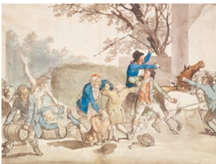
«Brännvinsbeslaget.» Brännvinsbränning i egen regi förbjöds och smugglingen blomstrade, konstnär: Pehr Nordquist omkring 1800.