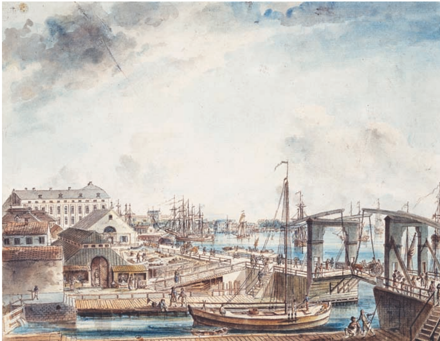
«Blå Slussen.» Polhemsslussen i lugnare väder, konstnär: Johan Petter Cumelin.