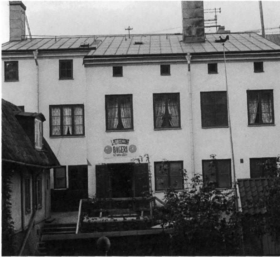
Petterssons bageri. Högbergsgatan 51 sett från huset mittemot, 1900.

S e på fotografiet! Adressen är Högbergsgatan 51 i kvarteret Stören. På skylten ovanför porten till stenhuset står det J. Petterssons bageri. Året är 1910 och till höger på gården skymtar lusthuset bakom grönskan. Till vänster är trähuset synligt. Fotografiet är taget av Albert eller Karl Pettersson.