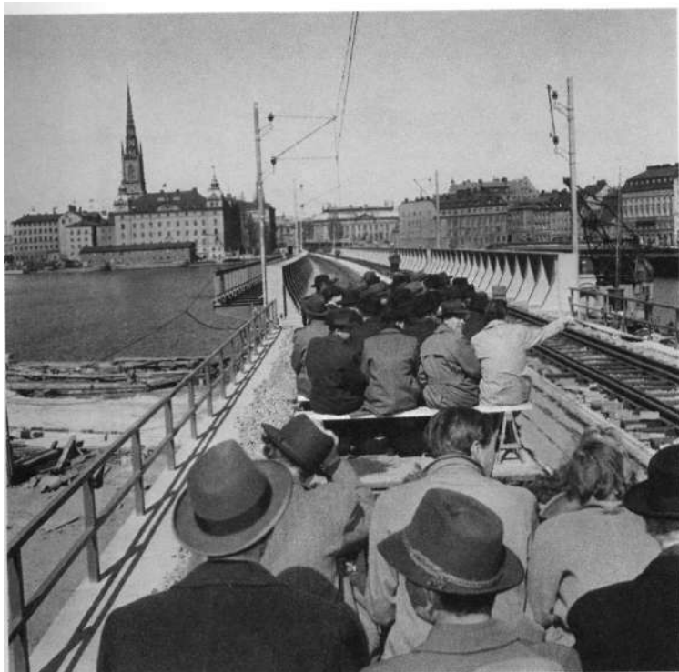
"Invigningståget" på väg ut ur den nya järnvägstunneln och över den nya järnvägsbron till Riddarholmen. Längst fram på trallorna sitter borgarråden Helge Berglund och Gösta Agrenius samt järnvägsgeneralen Erik Upmark. Bygget kallades för en kompromiss mellan skönhet och effektivitet. Foto: Gunnar Lantz, 21 april 1954.