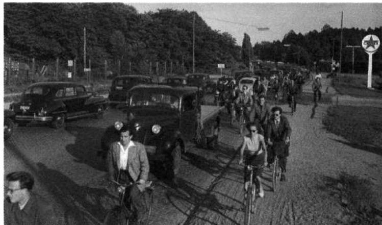
Fotbollsmatchen AIK-Hammarby drog 30.000 åskådare till Råsunda. Här de kompakta karavannerna på Solnavägen. Foto: John Kjellström, SvD, 4 augusti 1954.