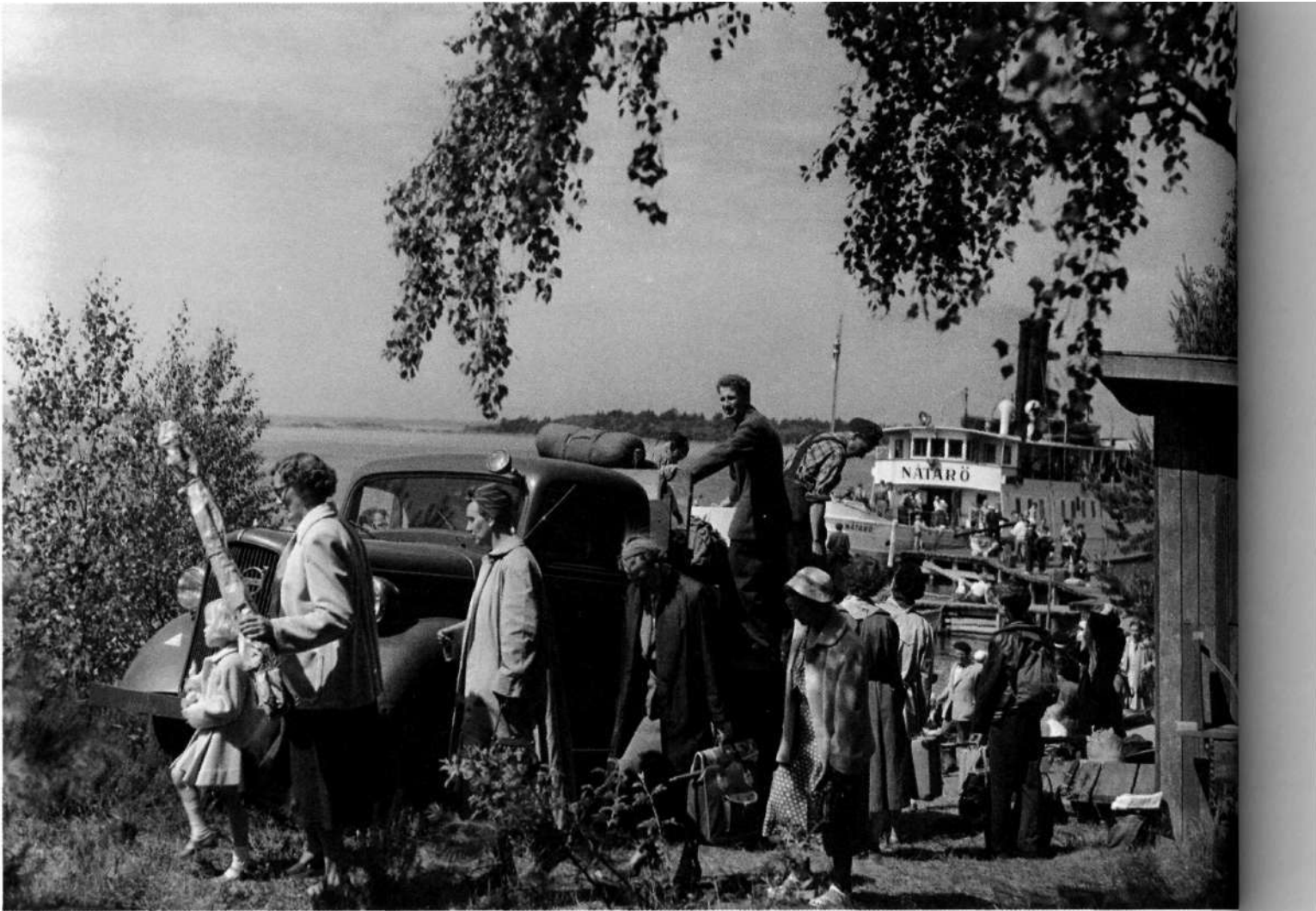
Nedan: Ångbåten Nätarö från Nynäshamn har kommit med nya hyres-gäster till Stockholms stads sommarstugor på Nätarö. Lastbilen transporterar det tyngre bagaget längre söderut på ön där stugorna ligger. Foto: John Kjellström, SvD, 4 juli 1954.