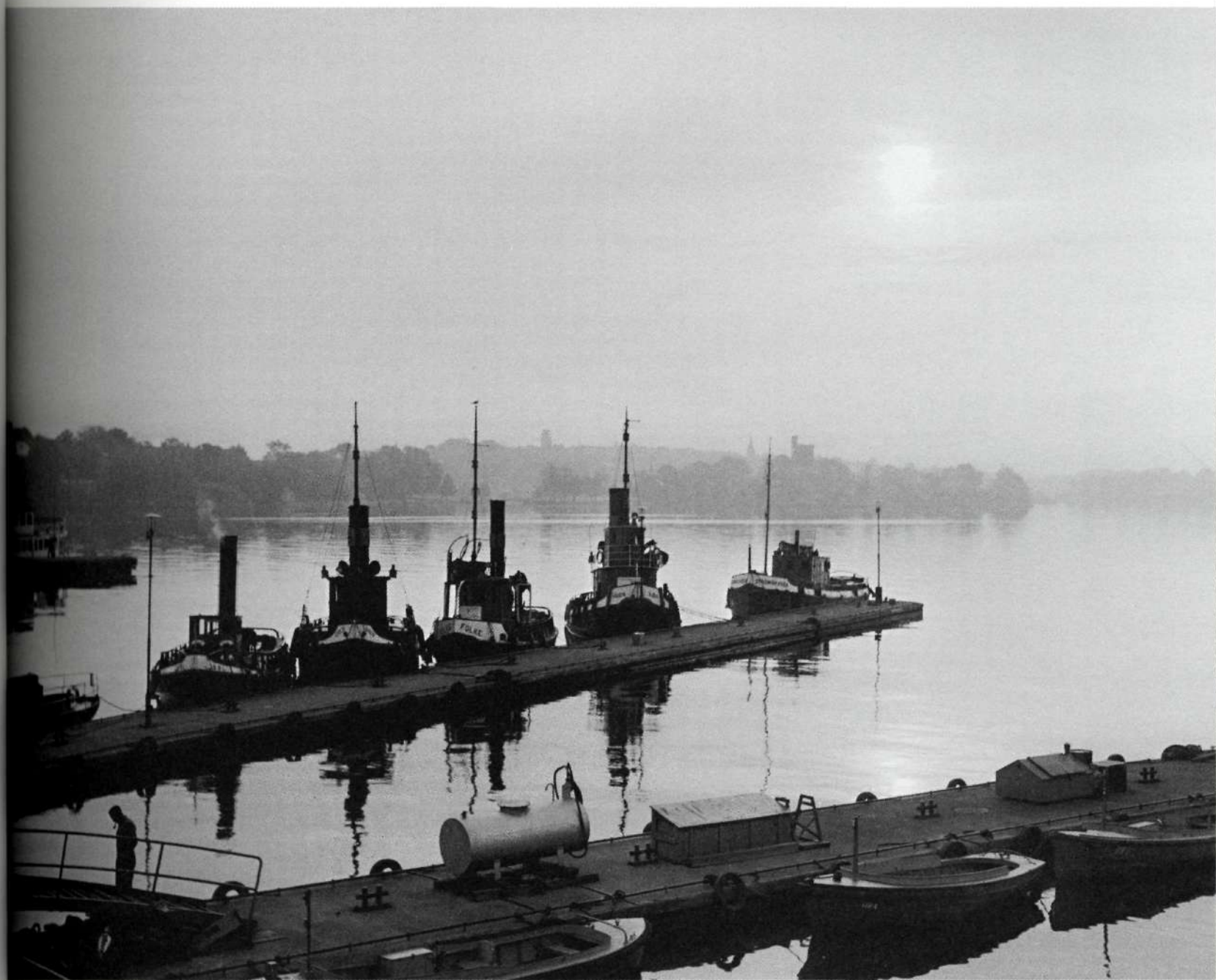
Gryningsbild av Transportbolagets bogserbåtar vid Slussen. Foto: Åke Blomqvist, SvD, 19 augusti 1954.