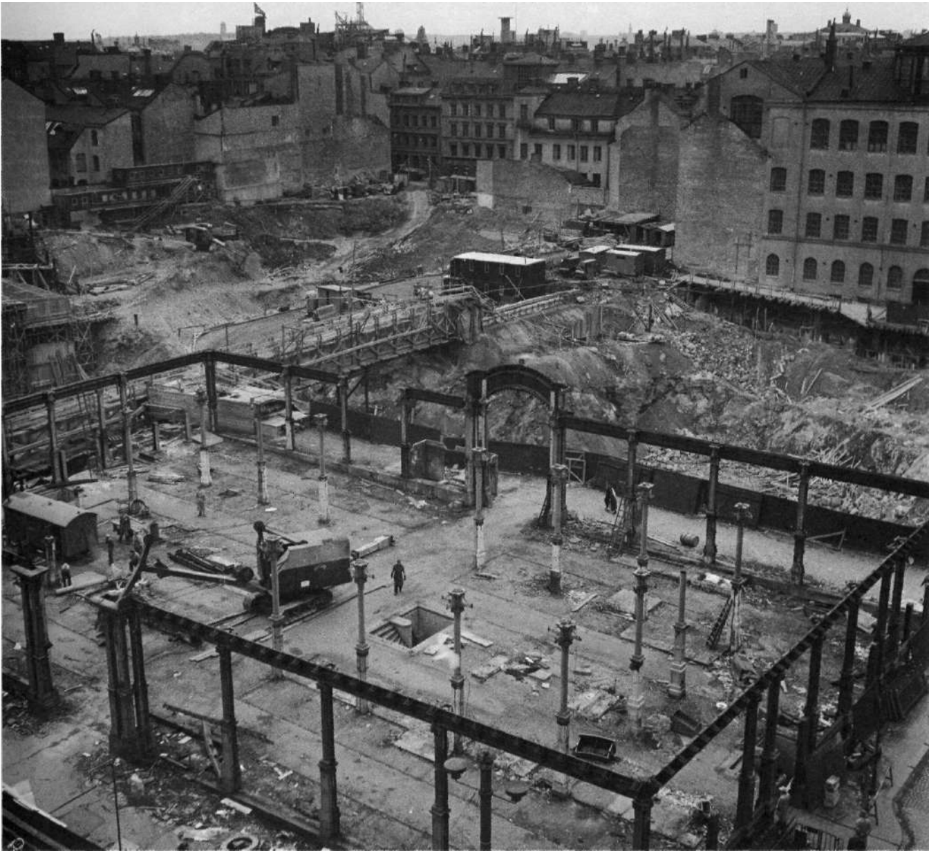
Rivningen av Hötorgshallen pågår och endast delar av järnskelettet står kvar. Bilden är tagen från taket på PUB. Foto: Gunnar Lantz.SvD, 14 juni 1954.