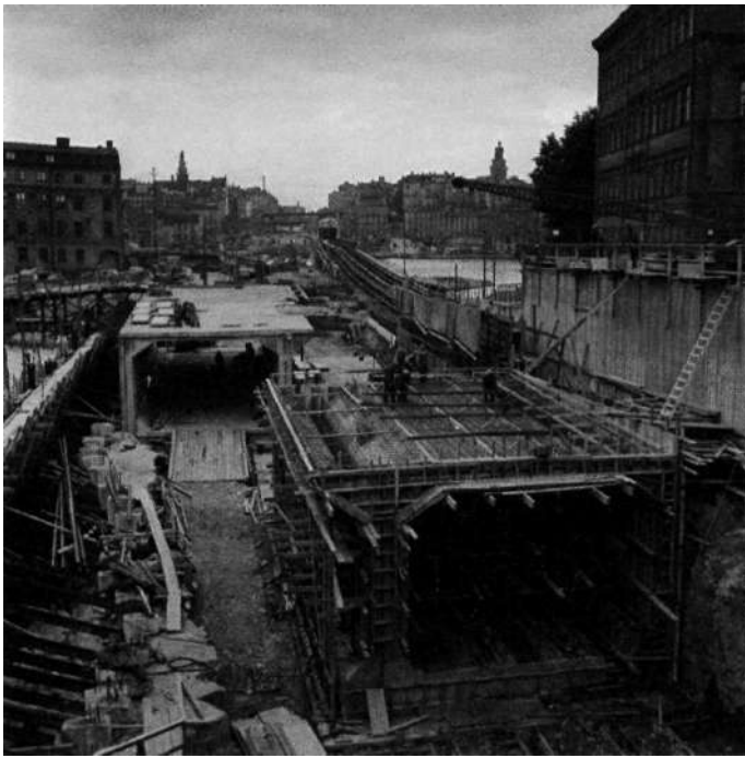
Tunnelbanebygget mellan Slussen och Riddarholmen pågår för fullt i ett virrvarr av betongtunnlar, berg och järnbalkar. Foto: Jan Ehne-mark, SvD, 19 augusti 1954.