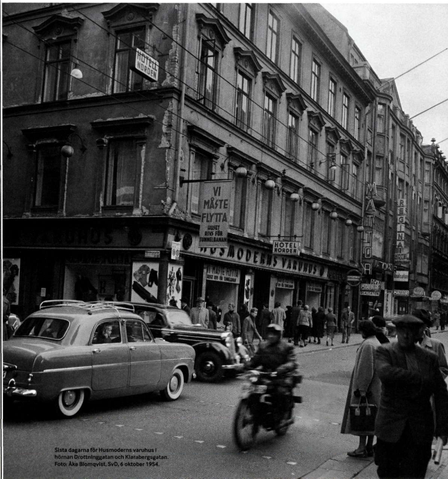
Sista dagarna för Husmoderns varuhus i hörnna Drottninggatan och Klarabergsgatan. Foto: Åke Blomqvist, SvD, 6 oktober 1954.