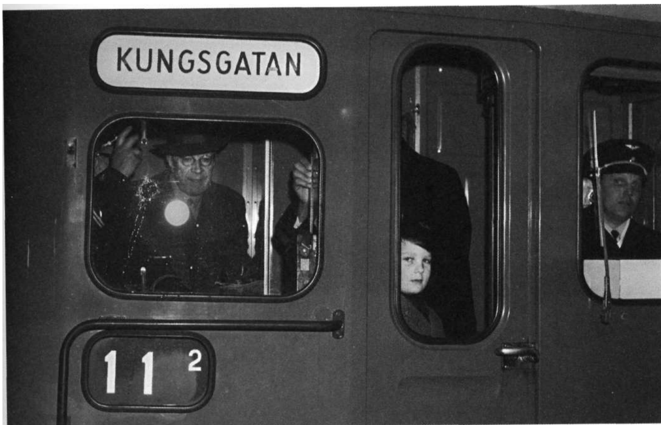
Nedan: Gustav VI Adolf stod i förarhytten när han på nyårsaftonen följde med ordinarie tåg från Vällingby in till Kungsgatan. Det var kungens första resa med T-banan.