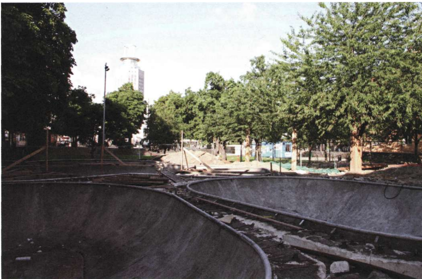
På utgrävningsplatsen anlägger man nu skateboardramper.

finner man att läge och riktning stämmer relativt bra överens. De två andra gatorna som hittades kan troligtvis identifieras på samma karta. På kartan finns egentligen bara en sträckning mellan Gråberget och Pelarberget som har ungefär samma riktning som den så kallade tvärgatan, vilket gör det sannolikt att det verkligen är den gatan som hittats. Allmäningsvägens existens är framför allt känd från skriftliga källor och från de äldsta kartorna. Den omnämns 1494 som "almenningx weggen som löper ffran ytre sudra port och op til korssit och cappelet och nesth östan repebanan". I en skrivelse från tiden före 1644 undertecknad Anders Torstensson omtalas Götgatans före-