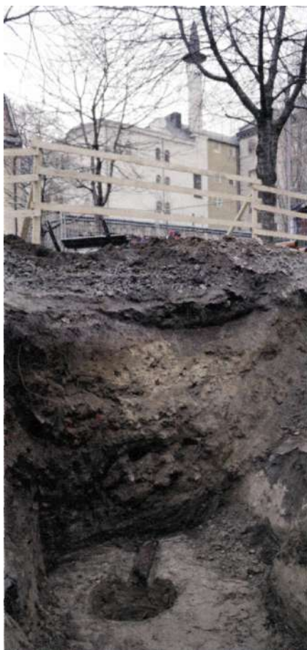
Brunn med anslutande vattenledning i trä.