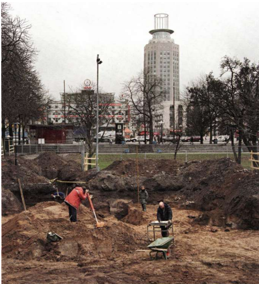
Utgrävningen vid Björns trädgård.

»De nya gatorna stakades ut med spiror och alla hus som stod i vägen blev tvungna att flyttas eller rivas.«