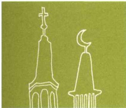
Från Björns trädgård ser man både moskéns och Katarinakyrkans torn.

som redan nämnts hittades ytterligare en brunn, ett dike och en mängd stolphål. De två brunnarna var konstruktionsmässigt lite olika. Den ena hade ett timrat brunnskar i botten. Två dendrokronologiska prover (dateringsmetod genom studier av årsringar) visade att träden fällts omkring år 1583. Intill brunnskarer hittades även två mynt från