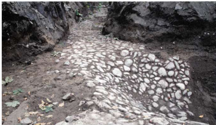
Sättning i en tvärgata på grund av underliggande brunn.

»Fyndmaterialet var relativt koncentrerat till slutet av 1500-talet och 1600-talet«