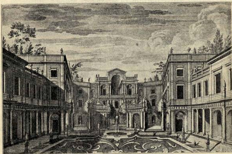
Tessinska huset; gårdsinteriör på 1730-talet.