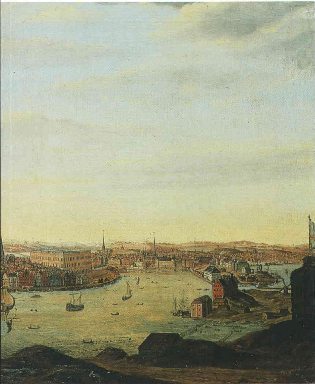
Stockholm från Kastellholmen. Oljemålning av okänd konstnär, början av 1700-talet. Utgår från Willem Smiddes kopparstick i Suecia Antiqua et Hodierna. SSM.