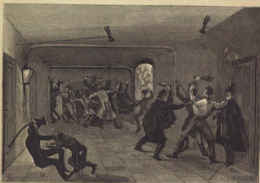
Fig. 215. Slagsmålet på Malmens källare d. 30 Okt. 1842.

Upplopp hördes åter icke af förr än 1848, det stora revolutionsåret i Europa. Fem tusen medborgare samlas i afton på Brunkeberg. Lefve reformen! Allmän valrätt! Det var hvad man läste på en proklamation som fans uppslagen på några gathörn lördagsmorgonen den 18 Mars. I allmänhet skrattade man åt den prokla-