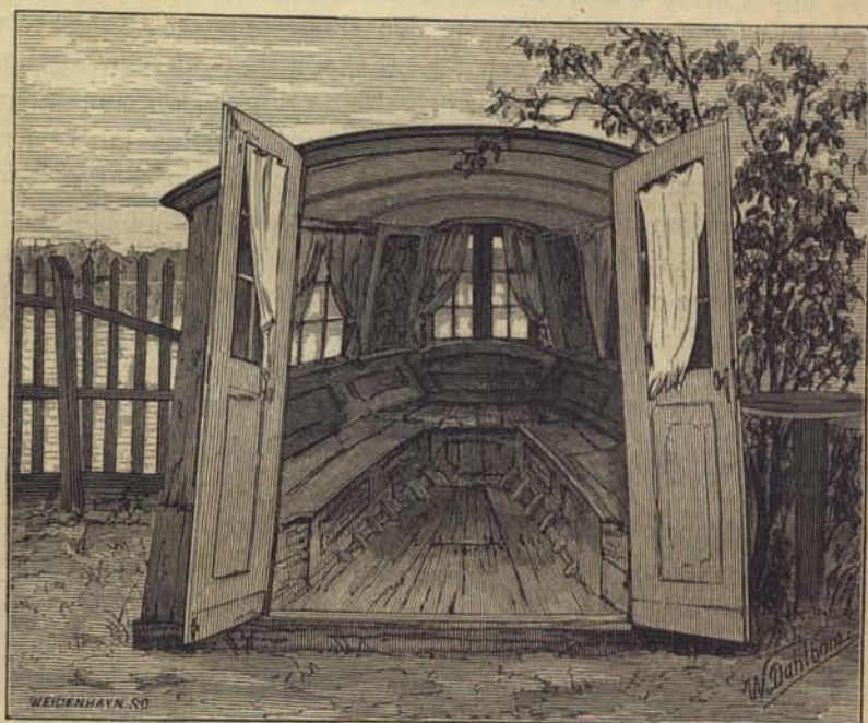
Fig. 214. Crusenstolpes kajuta på Kastellholmen.