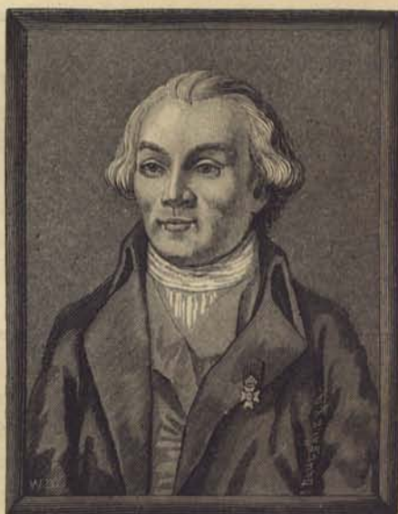
Fig. 208. Henric Liljensparre, Stockholms förste polismästare.

Liljensparre utnämdes 1792 till underståthållare, men erhöll afsked redan året derpå. Den nya regeringen ville aflägsna honom, liksom så många andra af Gustaf