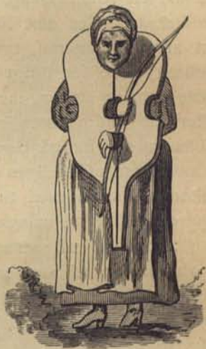
Fig. 219. Spanska fiolen. Efter handteckning.

Kopparmatte och kåken voro ej de enda som intagit midten af Packartorget. Der fans äfven en trähäst till okynnige och djurplågande åkaredrängars bestraffande. Vid kåken brändes också lagdömda skrifter, såsom då en af Johan Vosbein utgifven smädeskrift, »honom Vosbein till schimff och androm till skräck och varnagel» af bödeln vid kåken, den 29 April 1700, offentligen förbrändes. Dessa straffredskap flyttades sedan till Träsktorget (nu Roslagstorg),