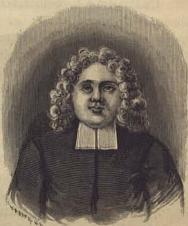
Fig. 217. Peter Brenner.

Göthes afrättning tyckes hafva väckt mycken uppmärksamhet, men, som nämndt är, många år förut afrättades på samma plats vida märkligare personer, såsom Görtz och Brenner. Den senares halshuggning tyckes hafva gjort nästan ännu större uppseende än den förres. Brenner (fig. 217), född i Österbotten 1677, hade varit med Carl XII i Turkiet och i Bender hållit den predikan som afbröts af kalabaliken, derefter utnämns till kyrkoherde i Wasa, men sedan sysselsatt sig mest med politiska stämplingar och mot svenska staten förrädiska