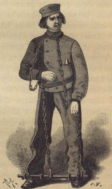
Fig. 220. På Smedjegården. Nordiska museum.

År 1674 vordo tjenliga rum, så väl för de fattiga barnen som för fångarne i tukthuset, utsedda i Barnhusets byggningar, och der tillverkades åtskilliga arbeten. År 1675 förordnades, att i tukthusbyggningen skulle uppsättas några handqvarnar, högst åtta par stenar, som borde drivas af fångarne. Planen till Rasp- och Spinnhus uppgjordes redan 1698, men sattes ej i verket förr än på 1720-talet, då staten af handelsmännen Spalding och Dahlström köpte deras egendom på Långholmen och der förlade den nya fängelseinrättningen som skulle stå under kommerskollegiets styrelse. Hvarje person som dömts till ett års arbete skulle spinna 720 strängar klädmakaregarn eller karda till 1,400 eller ock skrubbla till 3,456 strängs spånad. Detta ändrades dock något, sedan en ny haspel införts.