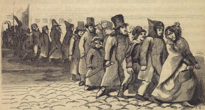
Fig. 216 Gåsmarsch. Ur Revue de Stockholm.

En sägen från 1700-talet påstår, att en missdådare vid namn Göthe skulle hafva varit den förste som afrättats på »galgbacken»