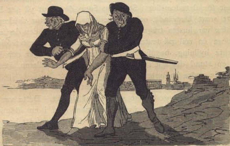
Fig. 221. »Paltar». Ur Mag. för konst, nyheter och moder 1827. Efter en handteckning af P. Nordqvist.

Polisbetjenternas sätt att gå till väga vid häktningar var ofta upprörande, och ej bättre uppförde sig de »kårer», stadsvakten och