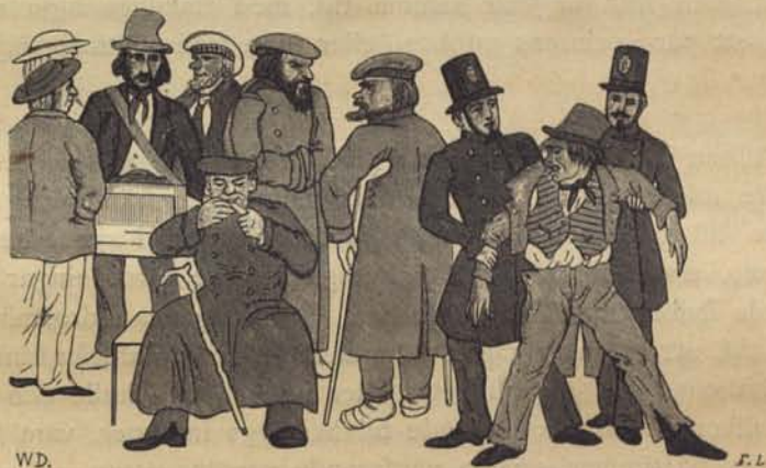
Fig. 222. Gatuscen. Efter handteckning.

Det var denna bevakningskår och dess föregångare som från gamla tider kallades »korfvar», ett namn som begagnats för mot-