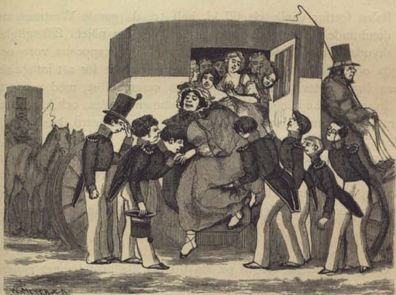
Fig. 191. Ankomst till en Carlsbergsbal.