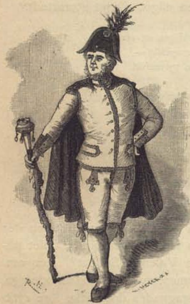
Fig. 188. Rumormästare vid Sabbatsbergs helso-brunn. Nord. Museum.

För att vaka öfver alla dessa påbuds efterlevande fans en af brunns gästerna utvald fiskal samt en af sju förståndige män bestående brunnsrätt, hvars ordförande brunnsintendenten skulle vara. En särskild och ganska vigtig tjensteman var den af rätten utsedda Rumormästaren , som skulle lemna handräckning åt rätten och fiskalen. Han var också en ståtligt utrustad person (fig. 188), hvilken uppträdde i gul drabantdrägt och med trekantig hatt samt till ytterligare tecken af sin värdighet bar en stor, rikt utsirad käpp (fig. 189), hvars knapp utgjordes af en penningbössa, der bötesbeloppen sannolikt nedlades.