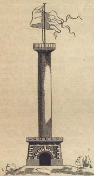
Fig. 187. »Tandpetaren på Söder».

Småningom bygdes dock i aflägsna stadsdelar en och annan malmgård , der de lyckliga egarne hemtade frisk luft och der de till och med slogo sig ned för längre tid. Det var då de förnögnare stockholmarnes sommarnöjen.