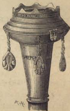
Fig. 189. Knappen på rumormästarens kapp.

Ungefär samtidigt med klagomålen öfver den stora sparsamheten gäfvos dock offentliga fester, vid hvilka det gick ganska frikostigt till. Till bevis härpå kunna vi uppvisa en matsedel** vid den bal med souper som magistraten och borgerskapet gäfvu på Börsen d. 9 November 1801. Denna matsedel är i noggrann afskrift följande: