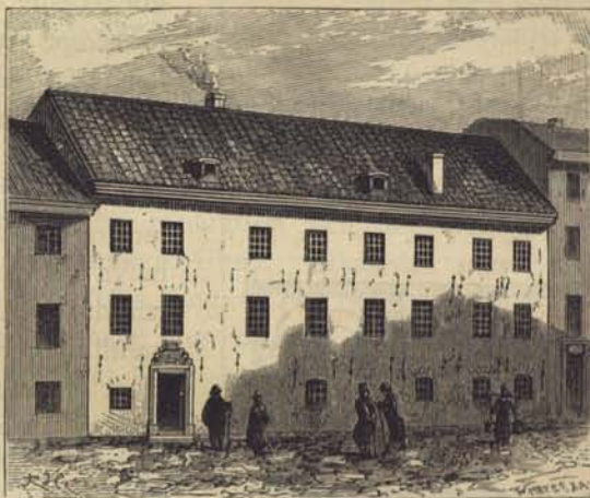
Fig. 141. Trivialskolans hus 1761. Efter en ritning i Stadens Byggnadskontor.

På denna ansökan finnes en af Karl den tolfte egenhändigt undertecknad påskrift, att konungen ville i näder veta, om magistraten