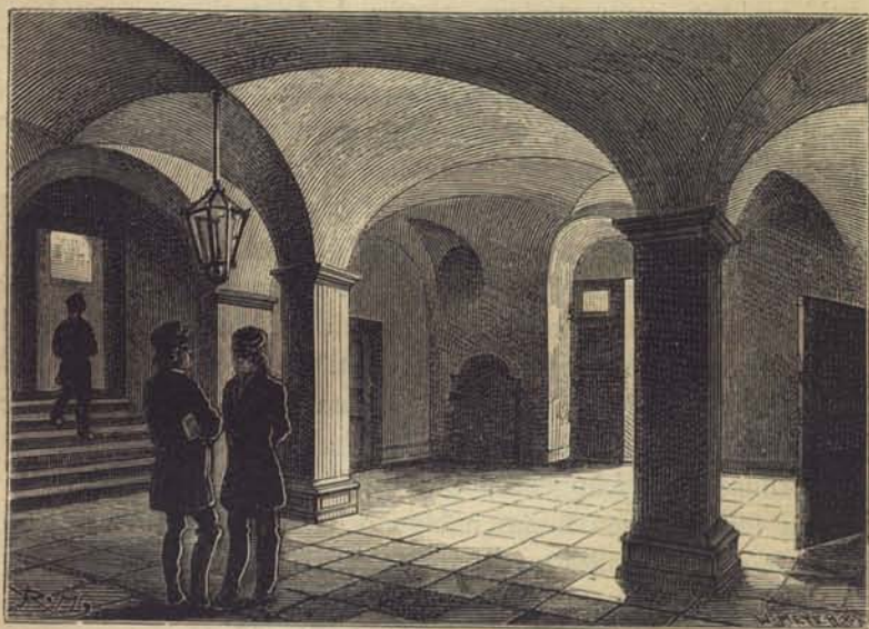
Fig. 143. Stockholms Gymnasii nedra förstuga.