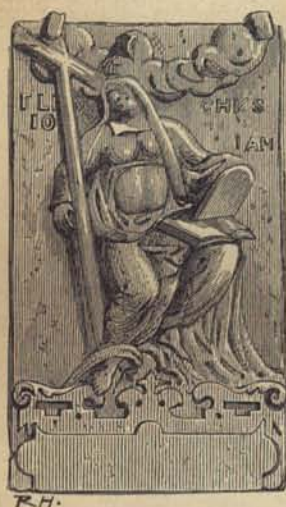
Fig. 145. Relief å Tyska skolans hus.