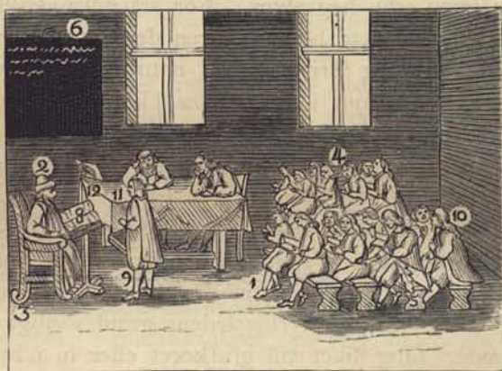
Fig. 140. Skolsal på 1600-talet. Efter Orbis pictus .

Att Jacobus Bose Rudbeckius, den ofvan nämde rektorn, betydligt hjälpte upp Trivialskolans, finner man af flera antydningar i skolfärderna. Han afled dock redan 1640, »uti den då i Stockholm graserande pesten», heter det i Rüdlings I Flor stående Stockholm , men om den dödsorsaken hafva Annales scholæ intet att förkunna. De