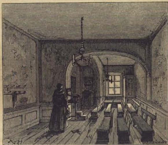
Fig. 146. Clara skolas förberedande klass.