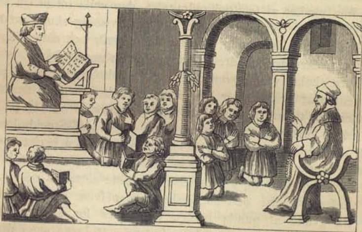
Fig. 138. Medeltidsskola. Efter Olaus Magni.

Så fortgick det, slägte efter slägte, ända långt in i vårt århundrade. Ehuru 1724 års skolordning uttryckligt föreskref, att »hvar och en klass hafver sina bänkar, hvaruppå skolpiltarne sättas i ord-