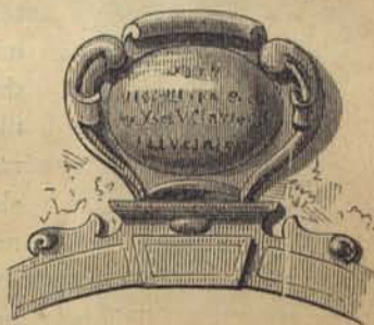
Fig. 144. Portöfverstycke å Tyska skolhuset.