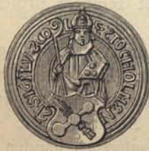
Fig. 139. Stockholms skolas sigill, från 1500-talet.

Om Stockholms Trivialskola fick nytt lif med reformationen, utdelade lärdomsbetyg och ville, att hennes sigill (fig. 139) skulle anses som giltig kunskapsprägel, tyckes hon dock åter hafva räkat i förfall i första fjerdedelen af sextonhundratalet. Man var åtminstone icke nöjd med undervisningen der, och det behöfdes den allmänna väckelse som Gustaf Adolf gaf läroverken för att rycka äfven Stockholmsskolan ur hennes dvala.