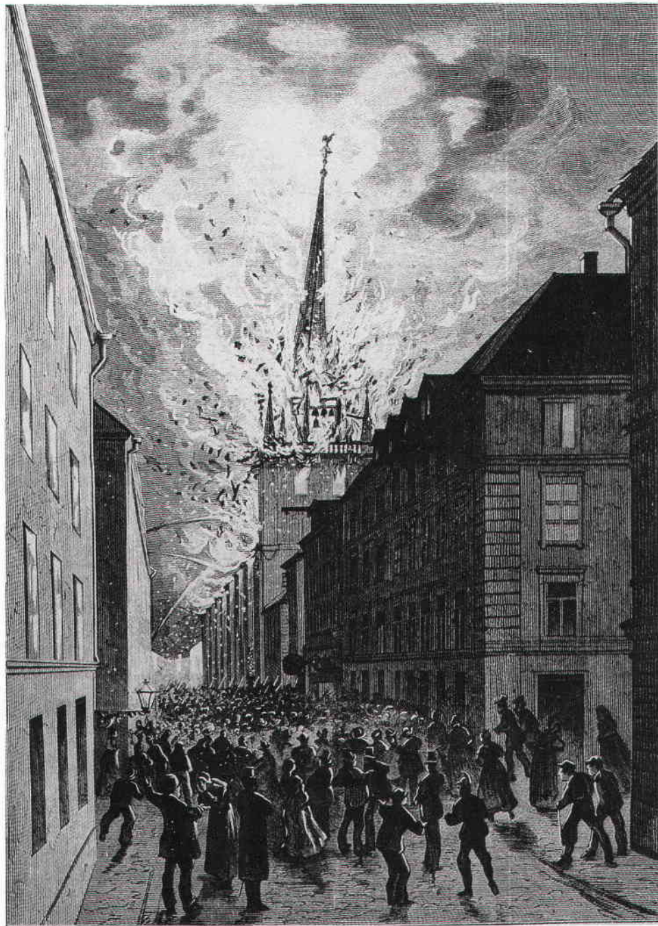
Tyska kyrkans brand, natten till den 7 oktober 1878. Tecknad av R Haglund. Ur Ny Illustrerad Tidning 12 oktober 1878.