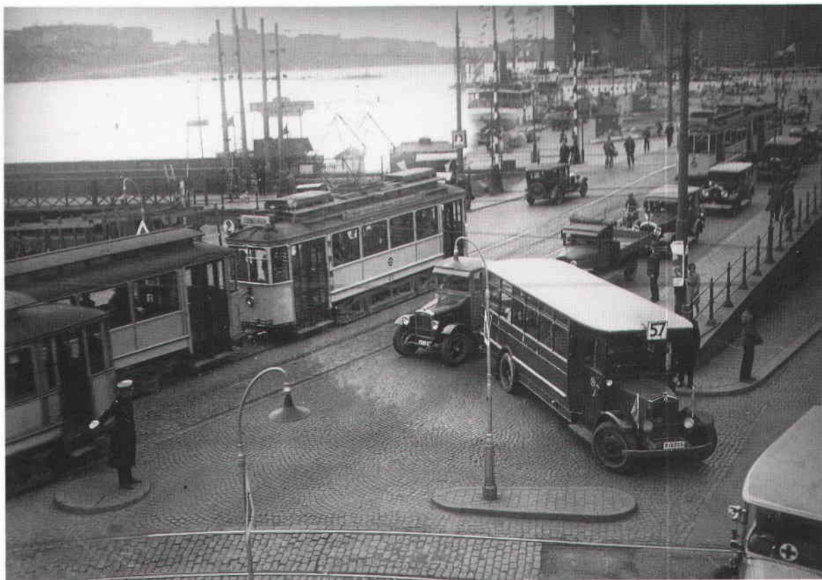
Tegelbackselände 1931. SSM.

Långt senare, i början av 1960-talet, berättar tidningarna i positiv anda om den Nya Tegelbacken, ett jättebygge som beräknas kosta 61,5 miljoner kronor. Enligt tidningen Storstaden från 1965 har man