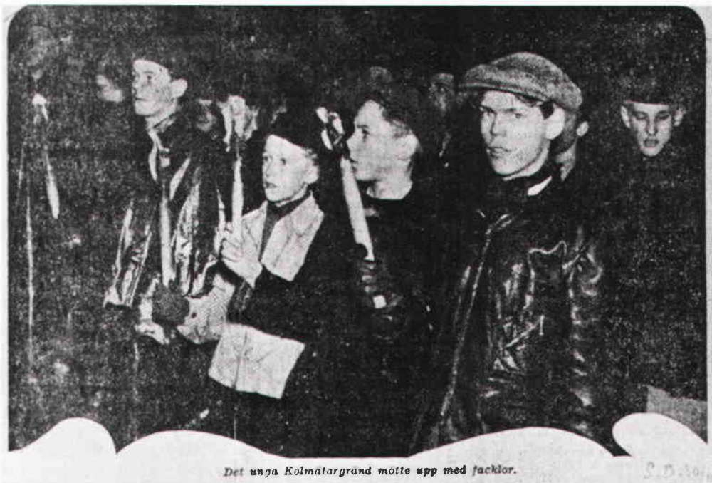
Det unga Kolmätargränd mötte upp med facklor.