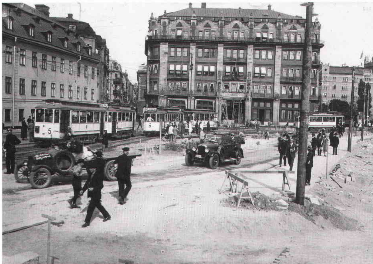
Tegelbackselände omkring 1920.

Svenska Dagbladet gör 1923 ett försök till hjälp för Tegelbackens ordnande. Tidningen utlyser en tävling, som inbringar 67 förslag. Upphovsmännen till de två bästa förslagen får i prissumma 250 respektive 100 kronor.