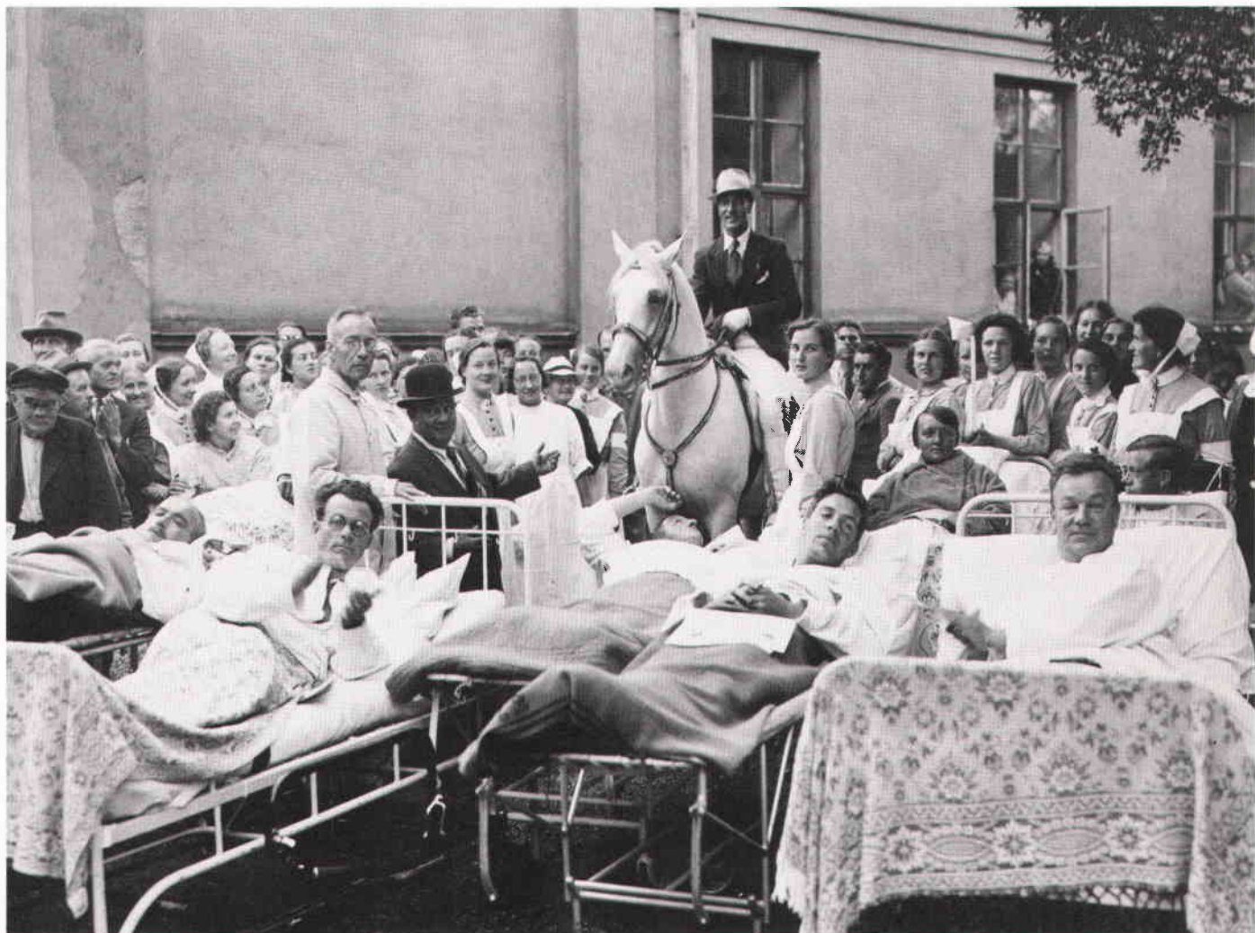
"Hästkur för sabbatsbergare". Cirkus Scott gav en föreställning för sjukhusets patienter i Sabbatsbergsparken. Foto 27 augusti 1937.