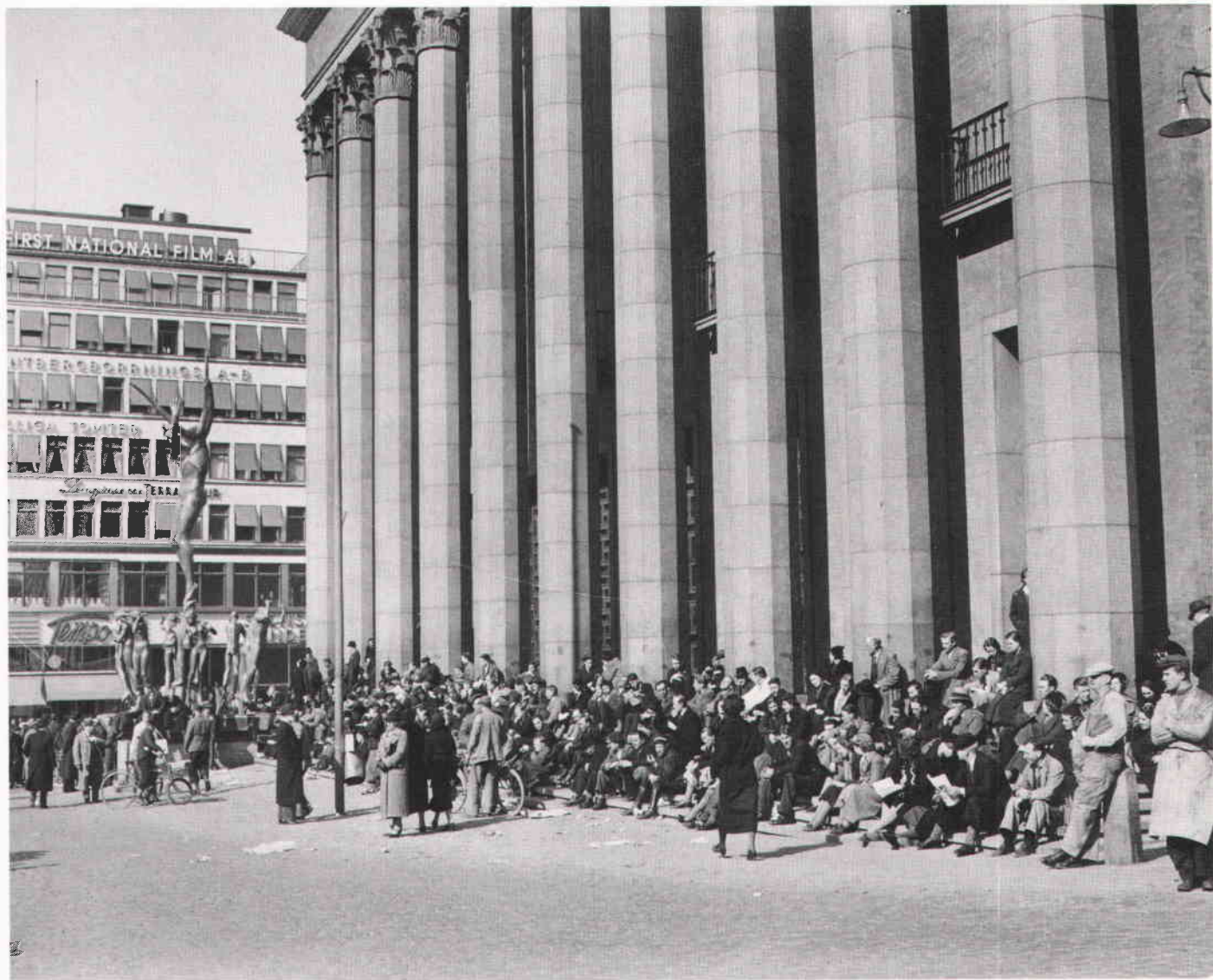
"Det sedan i fjol existerande soldyrkarsällskapet 'Orfei Vänner' på Konserthustrappan". Foto 14 april 1937.