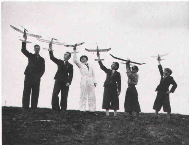
"Stockholms modellflyg mönstrar på Gärdet". Foto 26 maj 1938.