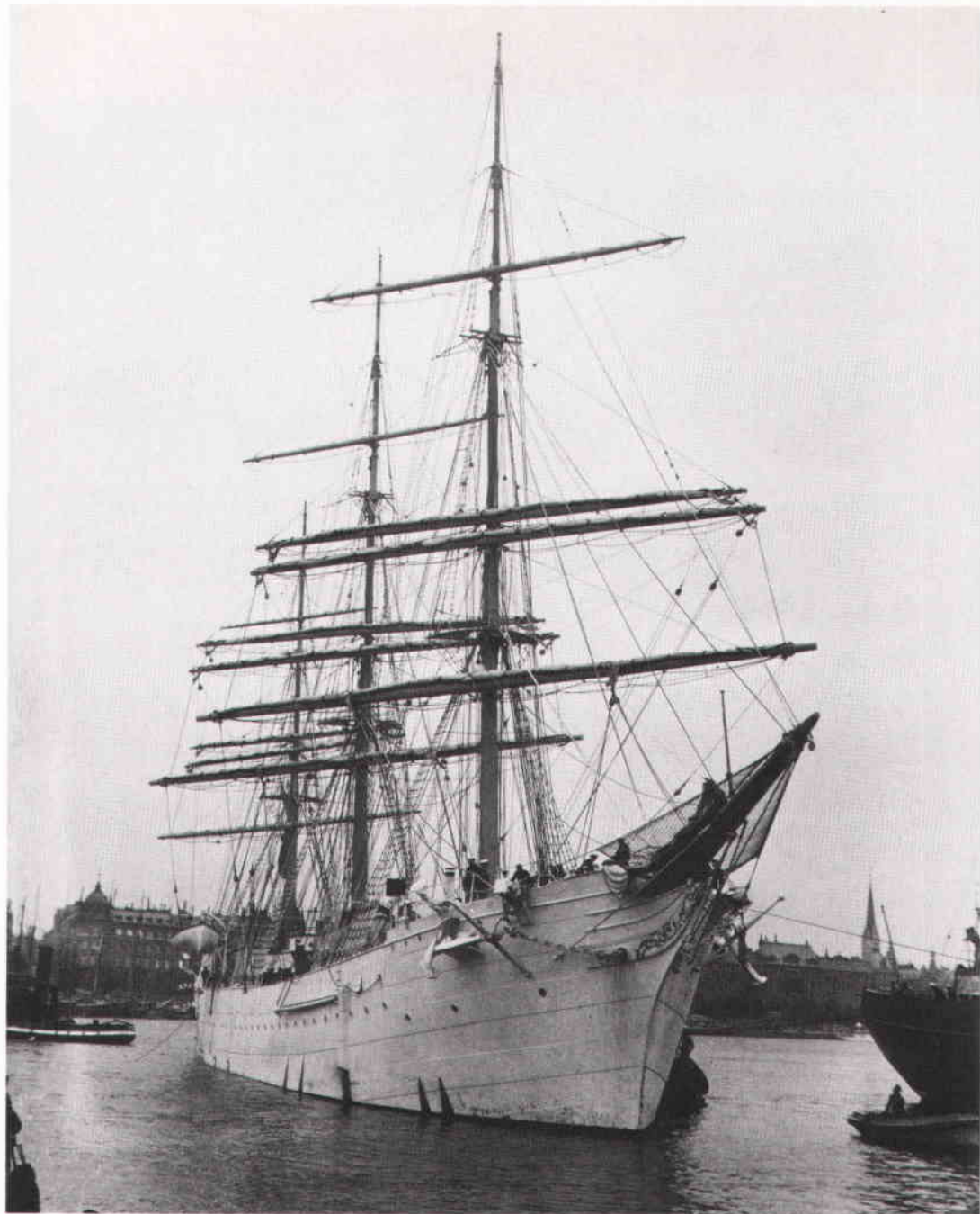
Fullriggaren af Chapman förtöjer den 7 september 1937 – efter sin sista seglats – vid Skeppsholmen för att bli logements- fartyg. (Fartyget blev vandrarhem år 1949.)