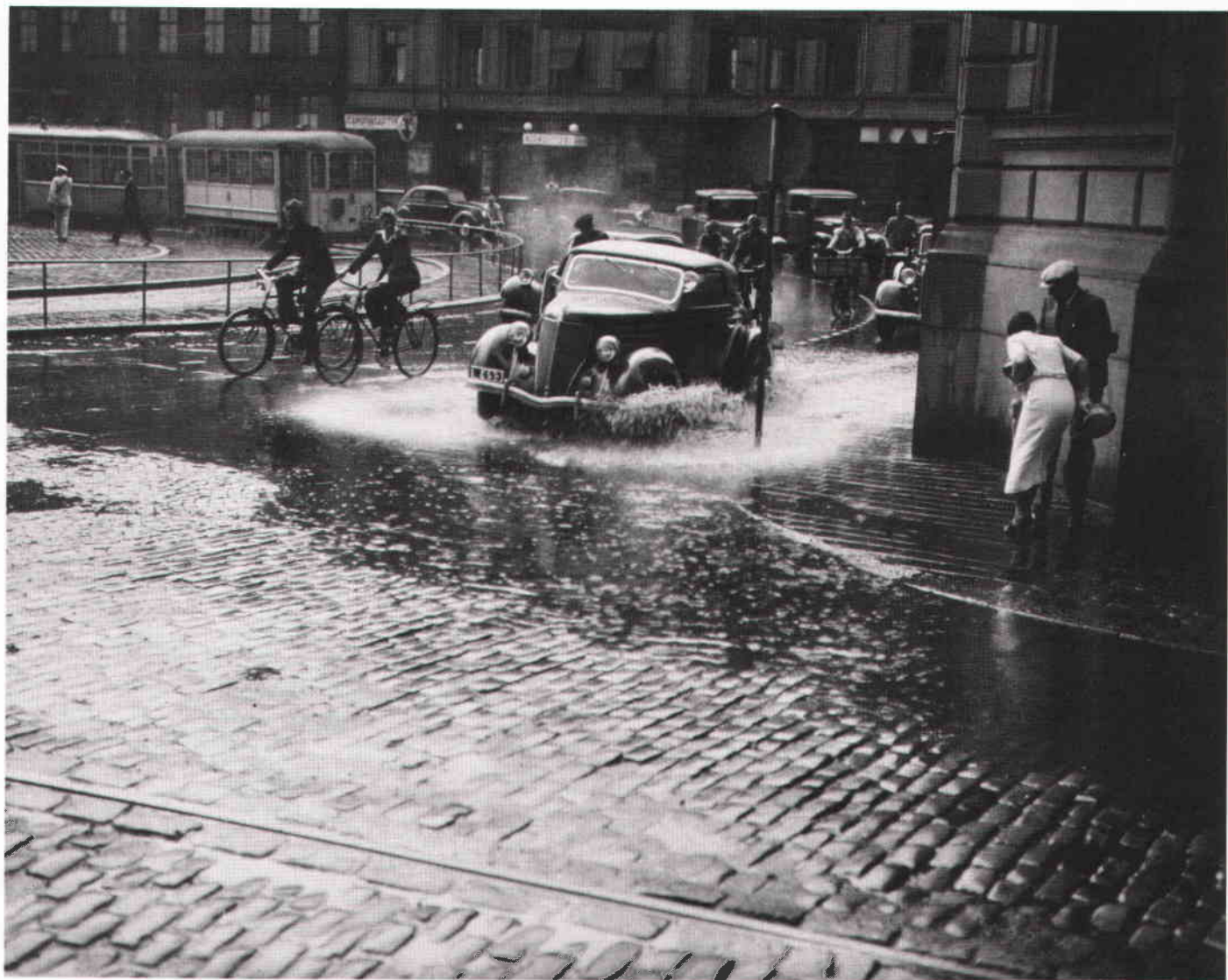
Skyfall på Tegelbacken. Foto 6 juni 1936.