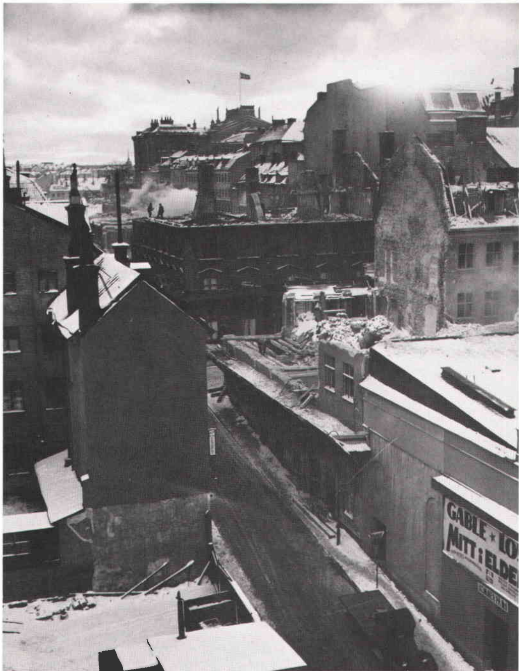
Bebyggelsen mellan Medborgarplatsen och Hornsgatan rivs i de- cember 1938 innan schaktningarna för Södergatan påbörjas.