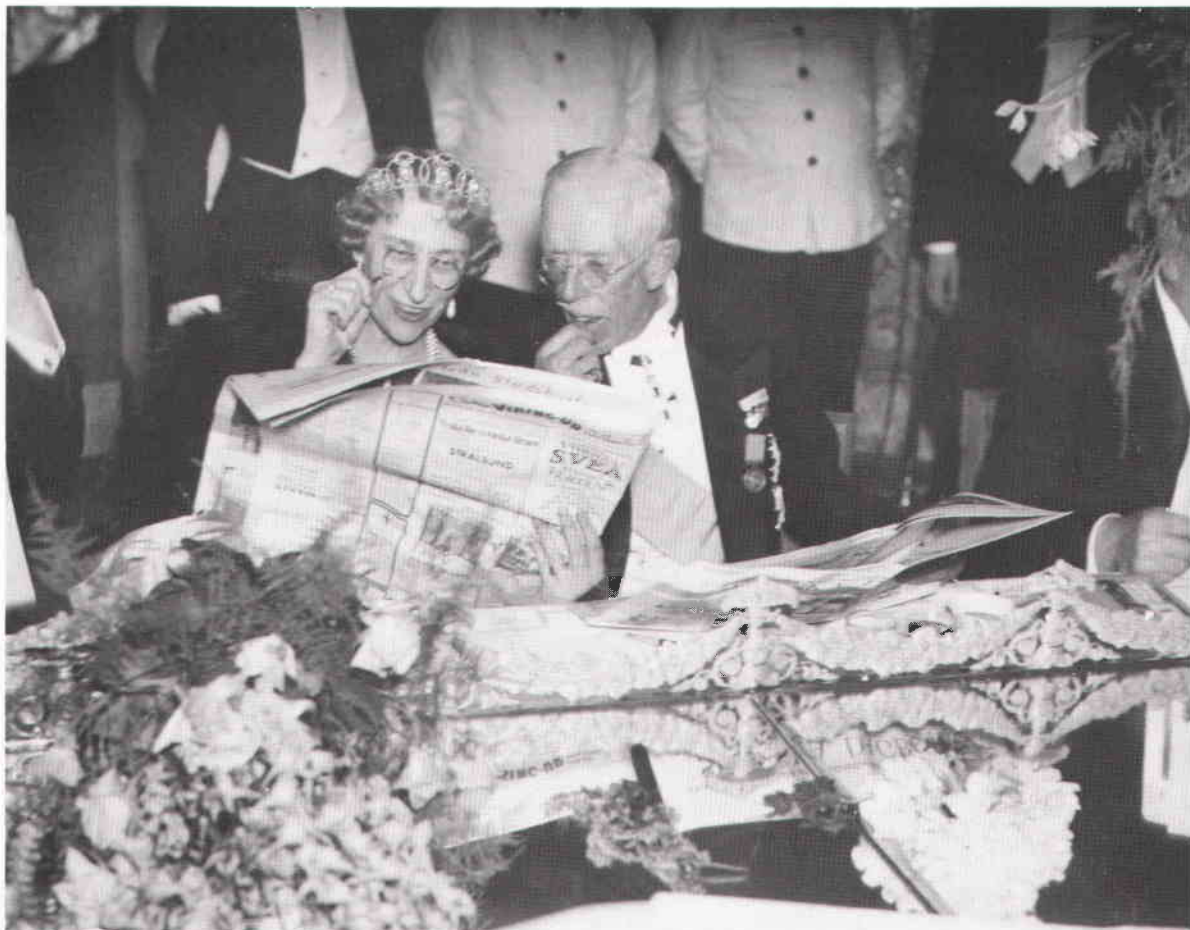
Gustav V och prinsessan Ingeborg studerar roat den särskilda stadshusupplaga av Svenska Dagbladet som delades ut vid Stadsfullmäktiges jubileumsfest i Stadshuset den 3 maj 1938.

ras eller utsättas för brutala gallringar därför att så få institutioner har de ekonomiska och praktiska möjligheterna att ta emot och vårda materialet. Dessutom förväntar sig de som vill överlåta samlingar en rimlig ersättning för bilderna och de rättigheter till användning som ofta ingår i förvärvet.