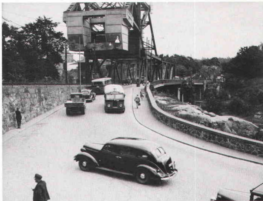
Danvikstull. Foto 16 juli 1938.