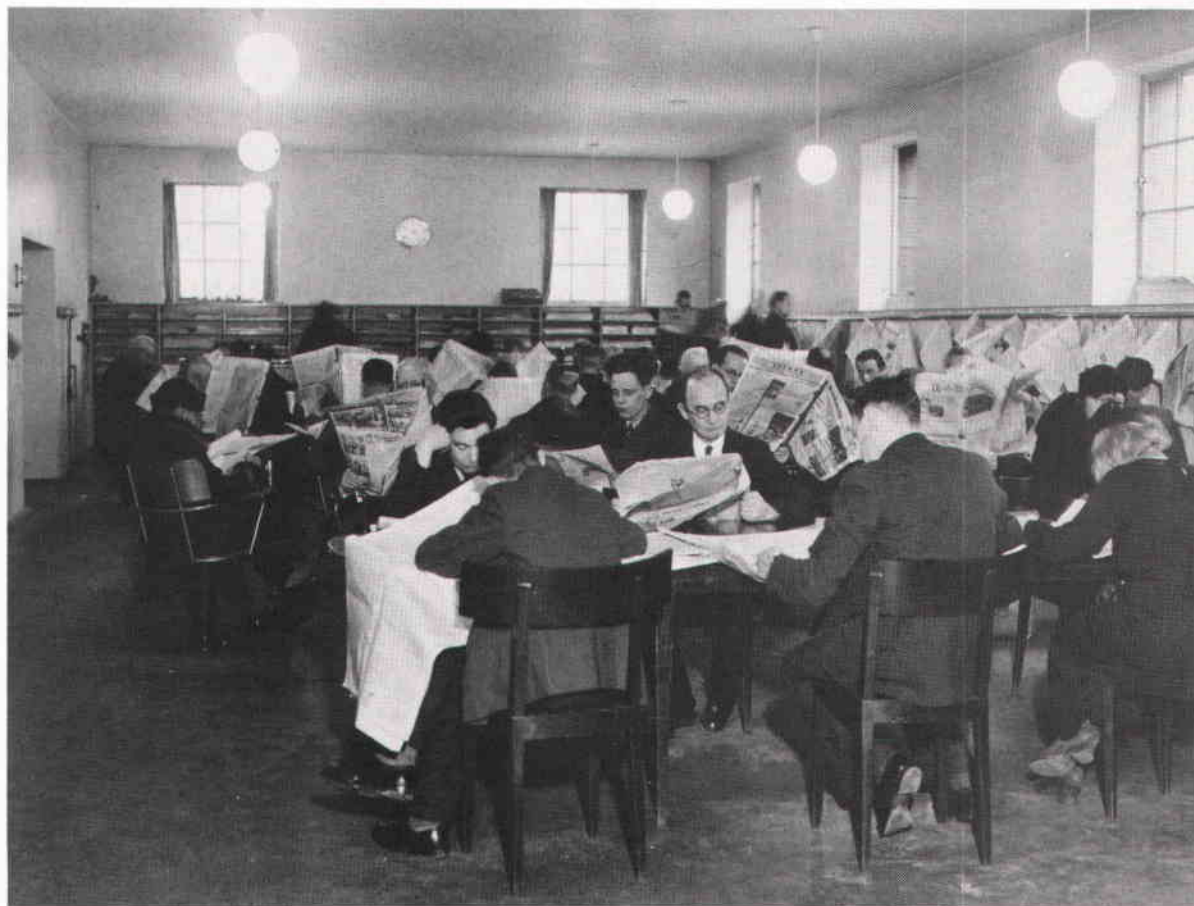
Stadsbibliotekets tidningsrum januari 1938.

med både traditionella metoder och med avancerad datateknik. Möjligen ler vår eftervärld om 50 år åt vår kanske något naiva glädje över vår datatilltro och åt våra hantverkmässiga lösningar för att göra våra fotosamlingar tillgängliga. Men för oss framstår 1987 som ett märkesår och en milstolpe. Det är det år då vi kan börja bläddra i våra negativsamlingar och samtidigt överge våra traditionella, sedan trettio-talet oförändrade negativläggare och kasta oss ut i dataåldern.