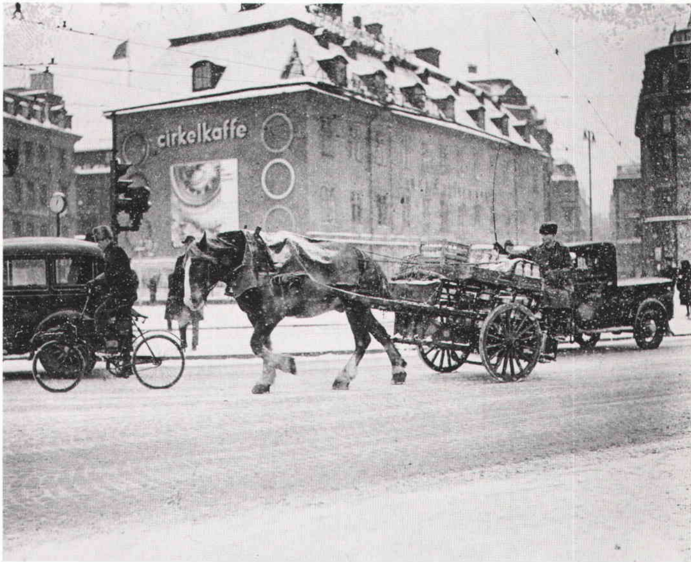
På Tegelbacken i snö. Foto 28 januari 1937.