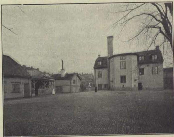
Stockholms stads militärförsörjningsinrättning.

Inrättningen hade då i tio år stått under fattigvårdsnämndens ledning. Af nämnden tillsattes en kommitté, för att afgifva förslag till anstaltens omorganisation. I sitt utlåtande 1 säga kommittéraden: »Merändels hafva hjonen varit sysslolösa. Denna sysslolöshet har naturligen ver-