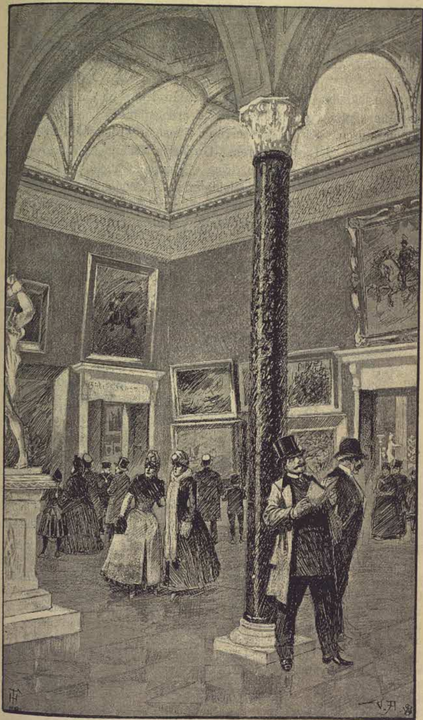
Interiör från Nationalmuseum.