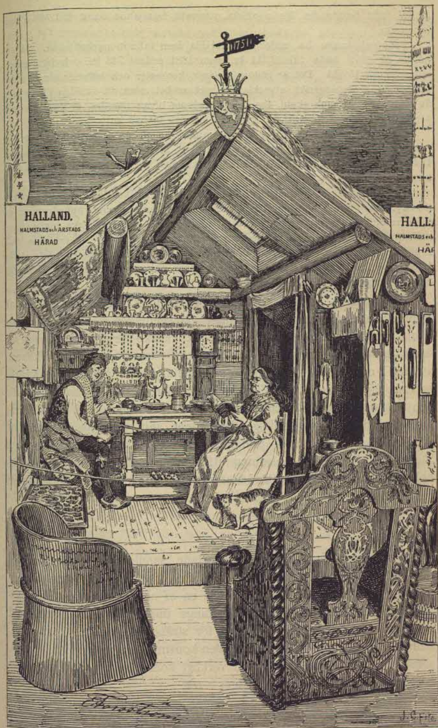
Interiör från Nordiska Museet.