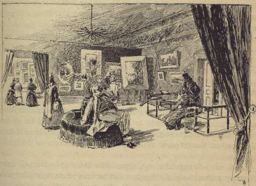
Interiör från Konstföreningen.

Det är på söndag middag, som konstföreningen har stor mottagning, i synnerhet mellan oktober och maj. Då strömmar folket icke blott till nationalmuseum, utan äfven till atelierbyggnadsbolagets hus, i hvilket Blancs kafé innehar bottenvåningen, konstföreningen bor en trappa upp och konstakademien förfogar öfver ateliererna i öfversta våningen. Klockan ett öppnas dörren, men redan före den timmen stå ofta många väntande i förstugan, och på slaget tränga de in i förrummet, där vaktmästaren står och kasserar in 25-öres slantar. Föreningens medlemmar erlægga ingen afgift, ty de betala antingen 10 eller 15 kr. i årligt bidrag.