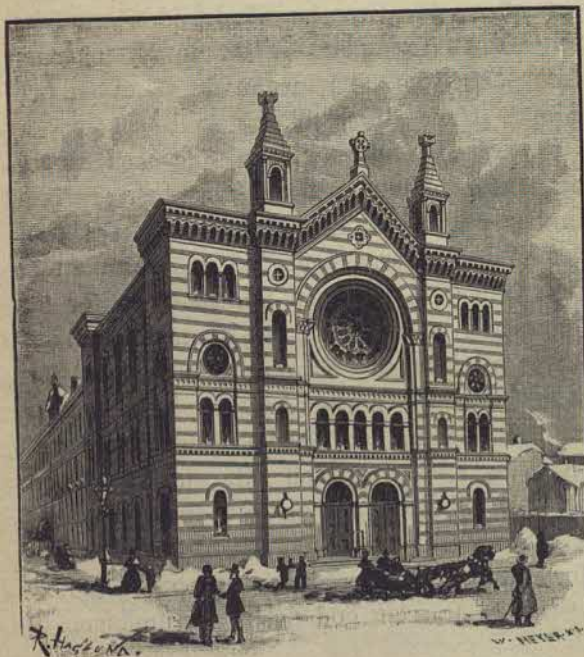
Kyrkan vid Floragatan.

distier och evangeliskt-lutherska kristna kunna vid hvarandras sida lyssna till predikningarna. Florakyrkan är en fridskyrka, där fördragsamhet läres och praktiskt tillämpas.