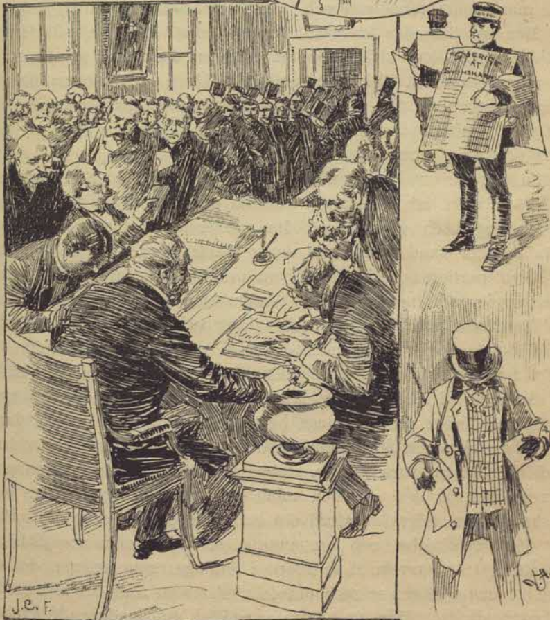
När Stockholm väljer riksdagsmän.