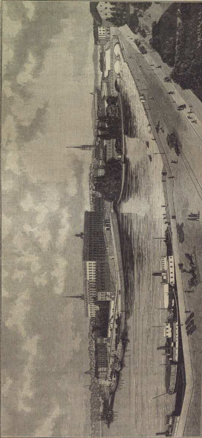
Stockholm från Södra Blasieholmskajen.