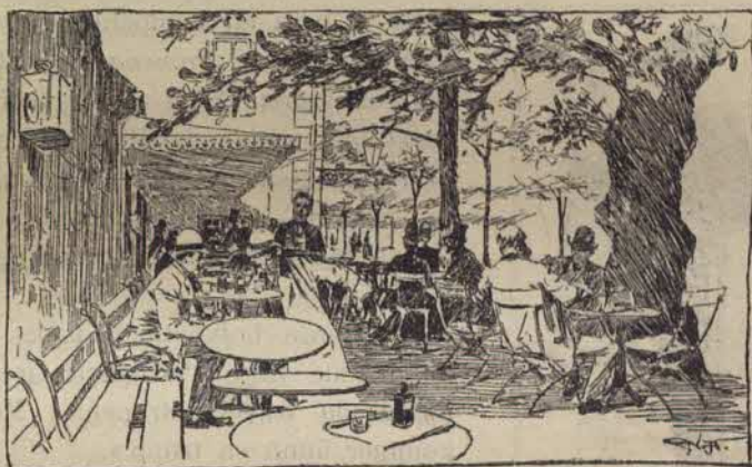
Vattenbutiken i Kungsträdgården.