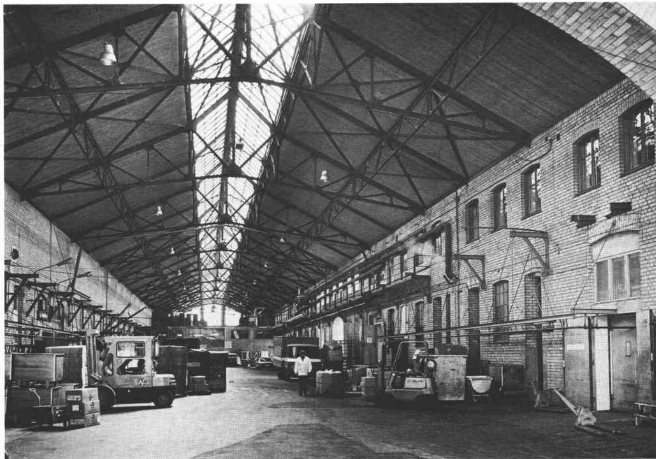
Hus I, slakthus