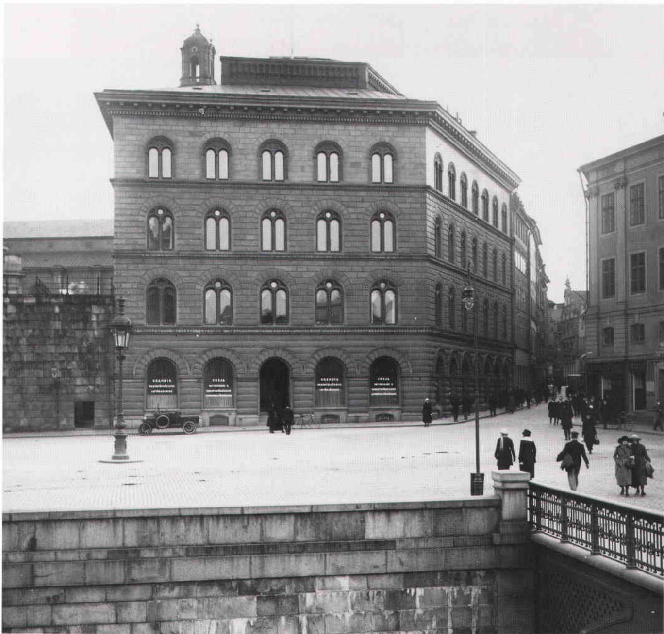
Skandiahuset vid Mynttorget före 1928 års ombyggnad. Foto i SSM.