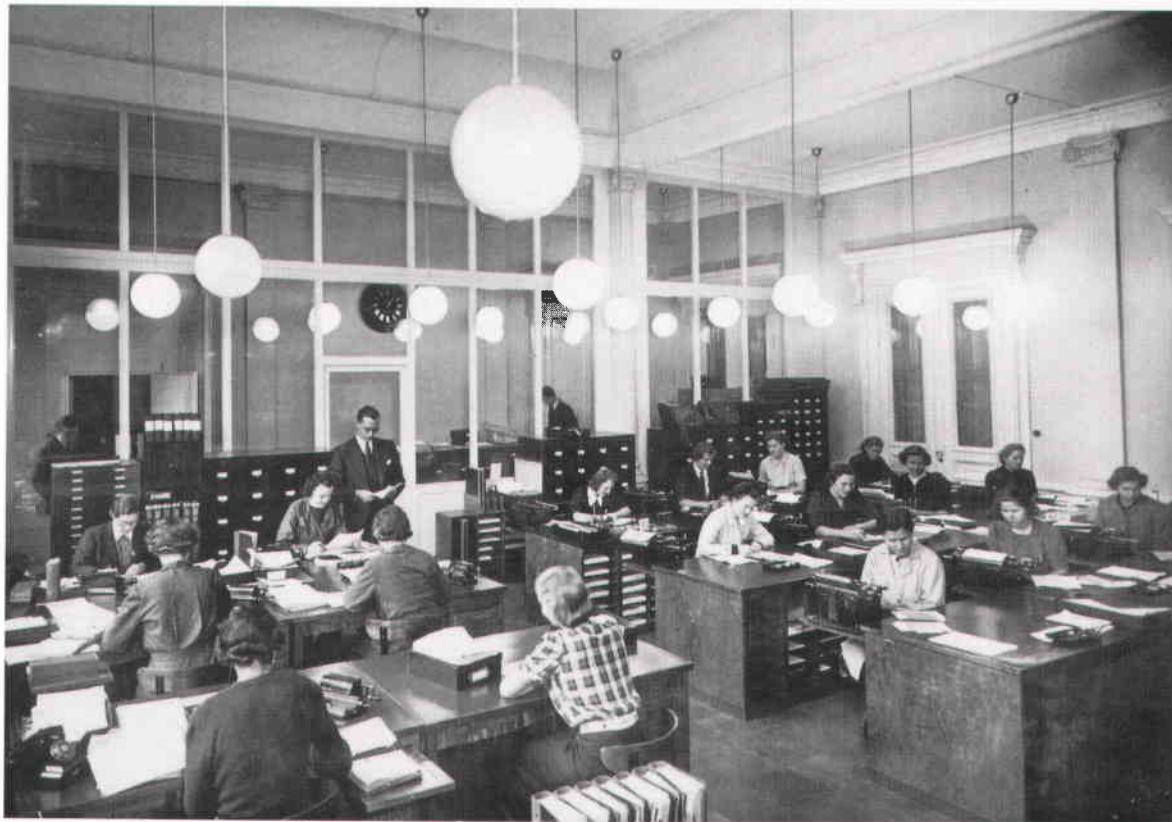
Ovan: Den avdelade expeditionssalen nedre del var skrivcentral 1938. Till höger: Expeditionssalens övre del med det ursprungligen förgyllda och bemålade stucktaket.

securitasvakt, som tryggt sitter bakom en glaslucka i en av dörröppningarna. Här blir det nu stopp. Inga obehöriga göra sig besvär. Säkerhetschefen måste informeras och vi förses med besöksbrickor. Därefter är det bara att gå in genom moderna glasdörrar till den inre entréhallen. För vaktmästare Hällén skulle det ha inneburit en chock. Hela rummet är målat i vitt och grått. Inga spår finns av den ursprungliga marmoreringen. Men skrapar man lite på de många färglagren kommer snart den kraftiga koloriten fram igen. I övrigt är rummet sig ganska likt. En hiss har installerats i trapphusets ljusschakt, så himlen kan vi inte längre se. När vi följer trappan upp blir vi nästan