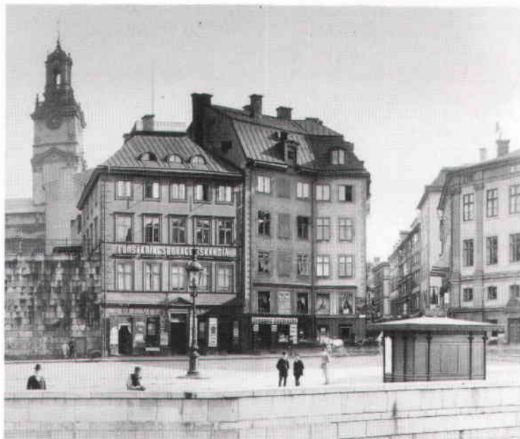
Mynttorget 1887, med Skandias första kontorshus till vänster.

Det hus Skandia förverkligade för sin verksamhet var ett av dåtidens modernaste. Huset omnämns i Claes Lundins bok Nya Stockholm från 1890. "Skandiahuset är otvivelaktigt ett av Sveriges märkligaste byggnader under hela århundradet" och "det tyckes kunna trotsa årtusen". Det samtidigt uppfattade som märkligt var nog främst fasadmaterialet och arkitekturen. Fasaderna mot Slottet, Mynttorget och Västerlånggatan var som ovan nämnt helt klädda med natursten, något som kom att bli vanligare under 1890-talet. Huset var på detta sätt epokgörande så som det första privata hus med fasader helt i natur-