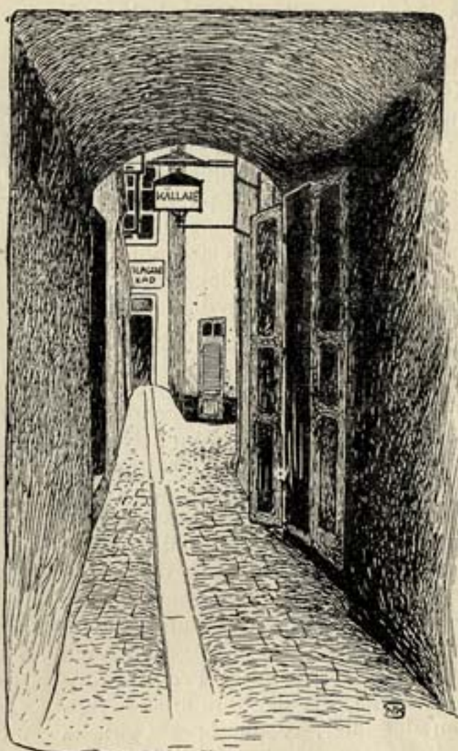
KROGEN, KÖPMANGATAN. INGÅNG.

I staden mellan broarne ha vi sett hur de med en viss »andakt» taga sitt glas i den rymliga lokalen (stor som en riktig balsal och med höga kyrkfönster uppe vid taket) som ligger där nere vid