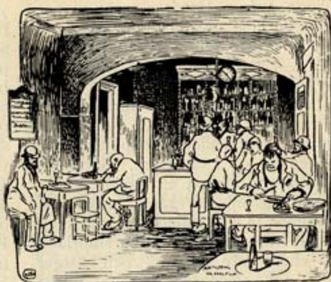
INTERIÖR AF »LÜBECK».

Vi börja då med en titt in på »Galoschen», som också kallas för »Löjtnantskrogen» eller »Lübeck» — Stockholms sämsta och ruskgaste