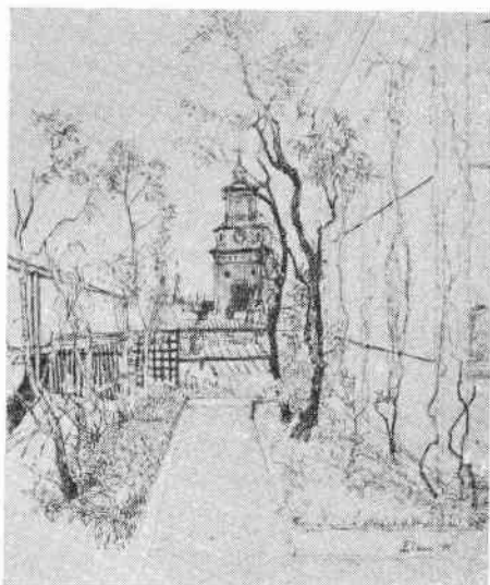
Takträdgården Götgatan 7. Utsikt mot Maria kyrka. Teckning av Lisa Bauer 1948.