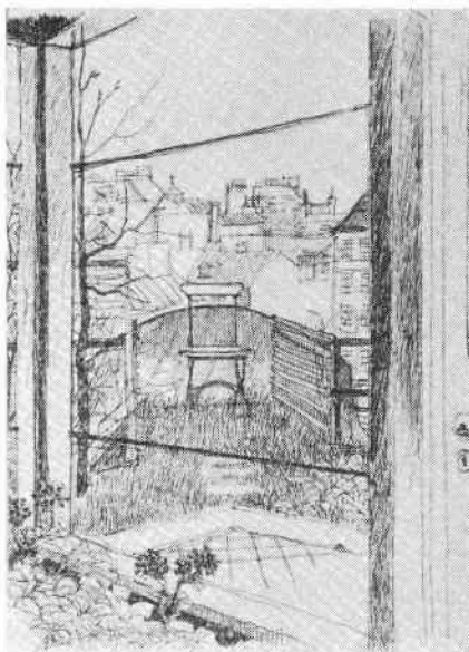
Takträdgården Götgatan 7. Utsikt från trapphallen mot söder. Teckning av Lisa Bauer 1948.