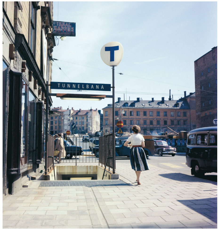
KÄNNETECKEN. T-symbolen som vi har känt den sedan 1950-talet.