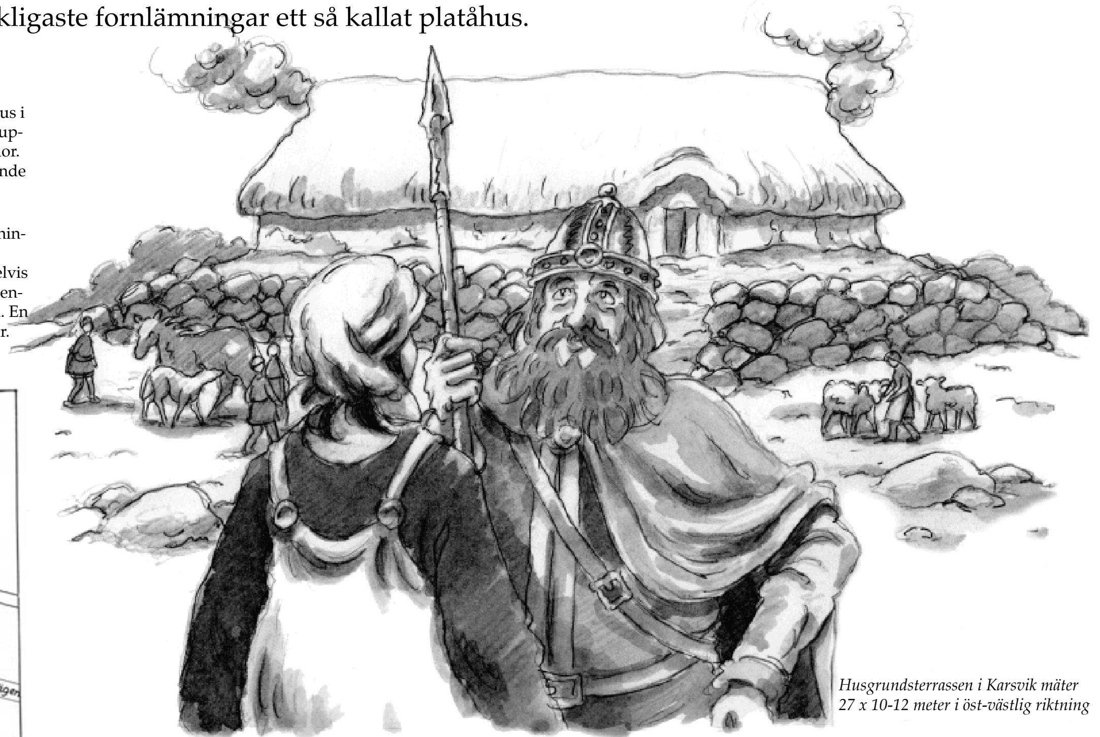
Husgrundsterrassen i Karsvik mäter 27 x 10-12 meter i öst-västlig riktning

Omedelbart väster och öster om gården ligger fornlämningar som utgörs av husgrunder, stensträngar och gravar. Från undersökningar av liknande platåhus som exempelvis Fornsigstuna (Signhildsberg) och Granby i Orkesta i Vallentuna vet man att det stått stora hallbyggnader på platån. En byggnad, vilken var avsedd för representation och fester.