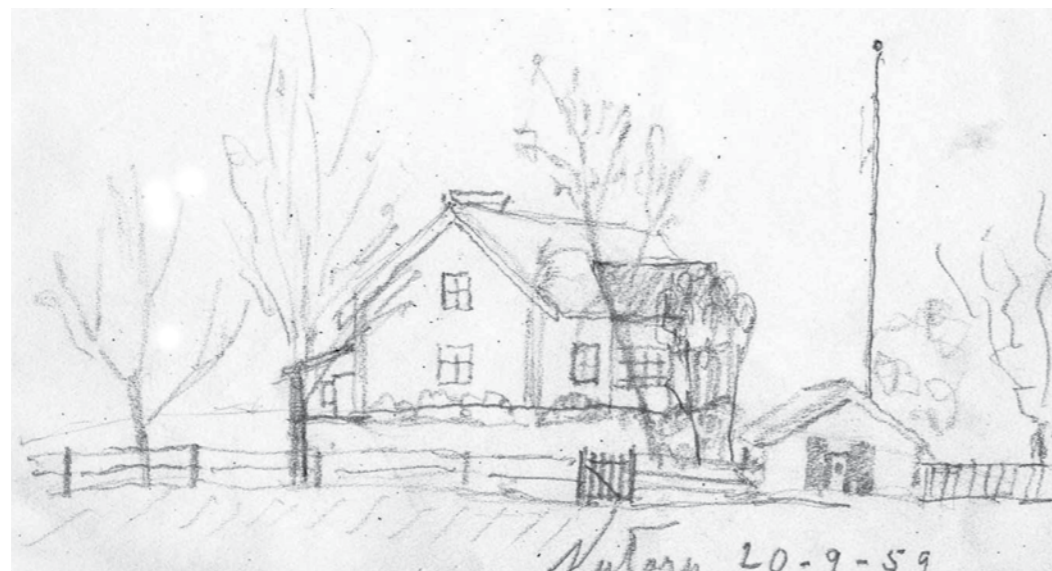
Torpet Nytorp som det såg ut två år innan det revs. Teckning i privat ägo.

Ofta begravde man de döda på ett gravfält i närheten av där man bodde, men var just dessa människors boplats har legat, vet vi inte säkert.