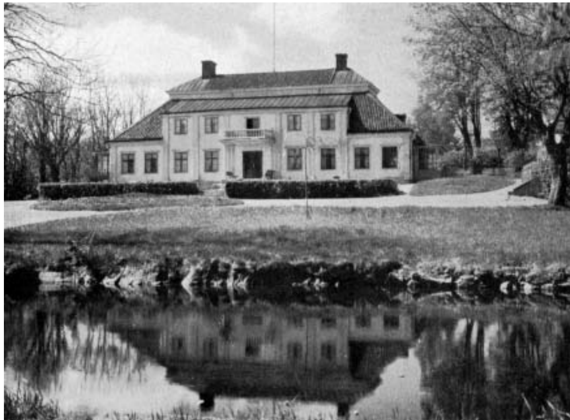
Långbro gård, gårdsfasad och spegeldamm. Dammen igenfylldes på 1960-talet. Foto 1928, från boken Brännkyrka genom tiderna 1941 av J.A. Widegren.

Långbro gård ägs idag av Stockholms stad och fungerar som privatbostad.