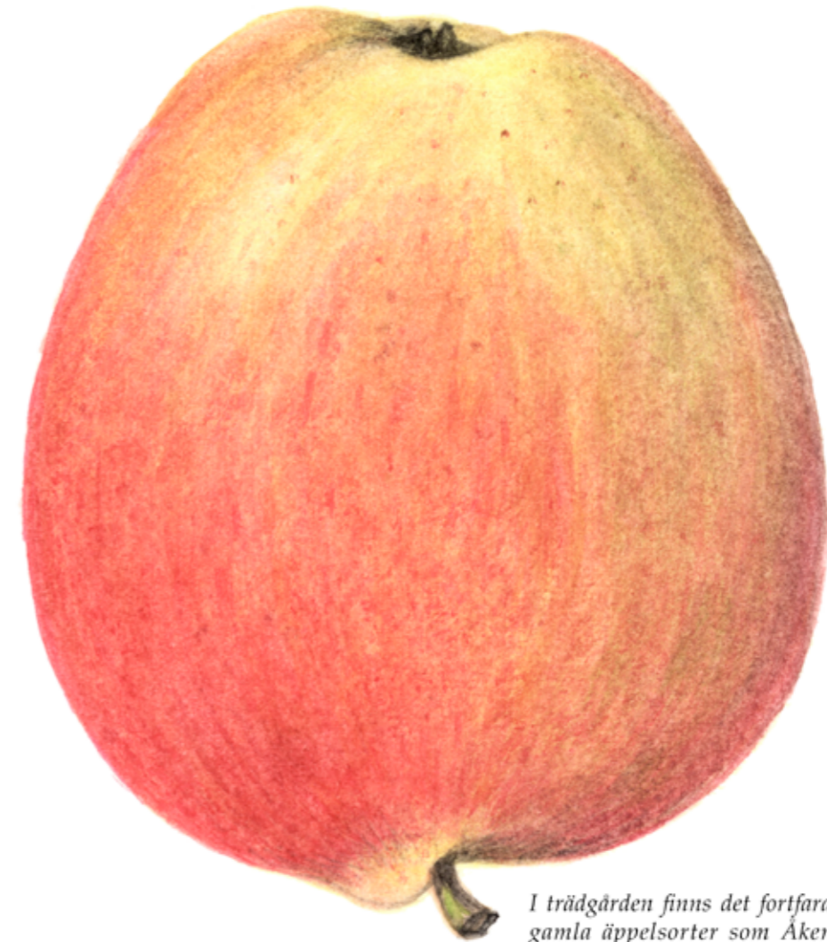
I trädgården finns det fortfarande många gamla äppelsorter som Åkerö (bilden), Säfstaholm, Oranie och Stor klar Astrakan.

Fruktträdgården har haft odlingar sedan slutet av 1600-talet. Den var ordnad med raka gångar och fyrkantiga odlingskvarter för fruktträden ända fram till 1800-talets slut, då dåvarande ägare "Långbrokungen" Alfred Söderlund lät göra om den. Fruktträden fick stå kvar och fortsätta att ge skörd, men odlingskvarteren lades om till rundade gräsytor kring vilka gångarna slingrade sig. En trädrad av askar kantar parken utmed Långbrovägen. Askarna är drygt 250 år gamla och har förut varit hamlade (beskurna). Förutom parkens fruktträd finns det gamla intressanta lökväxter. På våren och sommaren kan man se stora bestånd av vårkrokus, vildtulpan och krollilja.