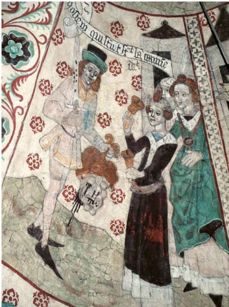
Ovan: Davids triumf, Täby kyrka, 1400-talets slut. Observera det svarta blodet som rinner ur Goliats avhuggna huvud.