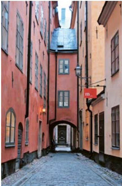
Överbyggd gränd i Gamla stan.

juni 1509. Han har då spelat orgel i en begravningsmässa i Sjalakoret, som han och hans verkstad på 1490-talet målat. Samma år försvinner han ur skattelängderna och troligen avlider han detta år. Med tidens mått mätt blev han en gammal man, runt 70 år.