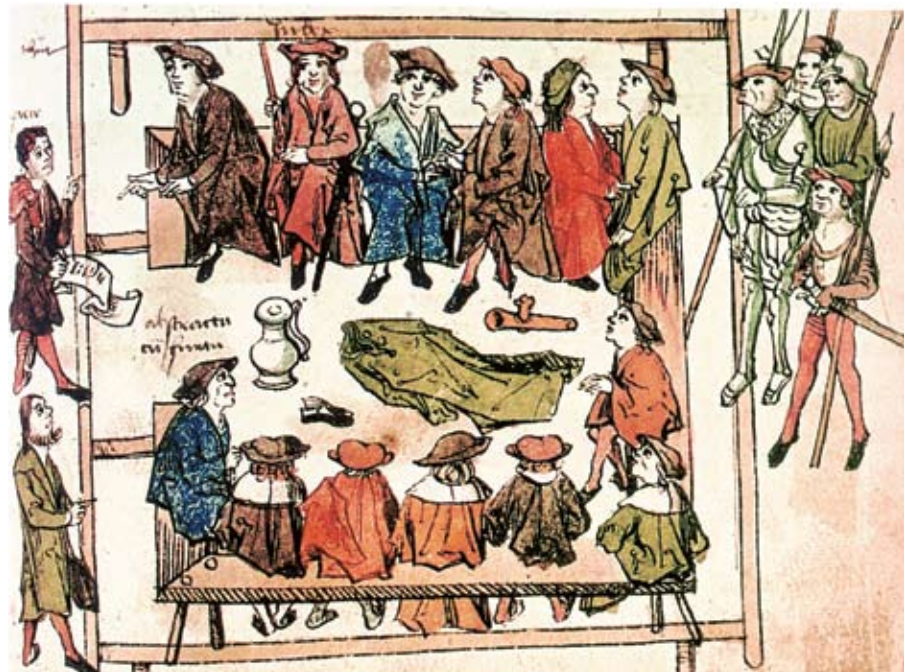
Rådssammanträde i Volkach i Bayern, år 1507. Illustration ur Volkacher Stadsbuch. Det finns inga bevarade avbildningar från en svensk rådstuga, men en svensk rättegång bör inte ha skilt sig så mycket från denna. Domaren sitter som nr två från vänster i den övre gruppen. Tjuven står utanför skranket längst ner till vänster och målsägaren står också utanför och pekar på tjuvgodset som lagts på golvet.

Andra läsvärda böcker är Albertus Pictor – målare av sin tid, vol. 1–2 , av P. Melin, C. Sandquist-Öberg, J. Svanberg och J. Öberg, Stockholm 2008, och Fåfångans förgänglighet. Allegorin som livs- och lärospiegel hos Albertus Pictor , P. Melin, Stockholm 2006.