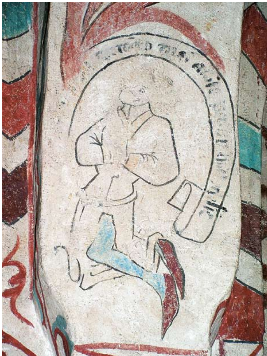
Albertus Pictors självporträtt och signering i Lids kyrka, Södermanland. Texten i språkbandet lyder efter den skadade inledningen: "memento mei Alberto pictor huius ecclesie" (minns mig Albertus, denna kyrkas målare).