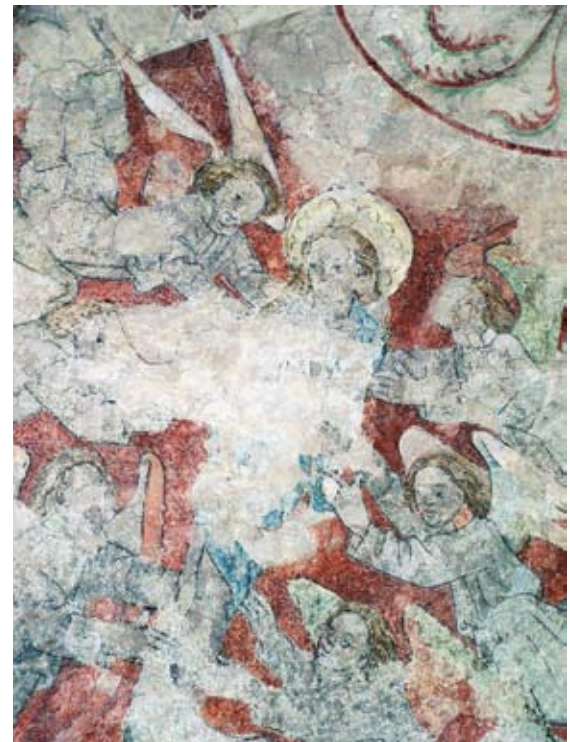
Ovan, höger: Marie himmelsfärd, Storkyrkan. Den dyrbara röda färgen gjord på mineralen cinnober har bevarats väl.