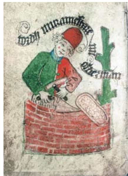
Tordh murmästare, från murmästarämbetes skråstadgar år 1487. Äldsta kända porträttet av en Stockholmsborgare.

omväxlande målare och pärlstickare. Antagligen målade han och hans verkstad kyrkor under de varma sommar-månaderna, medan han under vinterhalvåret istället arbetade som brodör. Det finns också en bokmålning bevarad som troligen är utförd av Albertus. Det