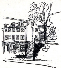
P. A. FOGELSTRÖM