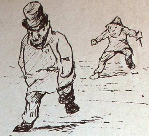
och börjar springa.