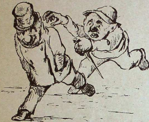
Bofven springer efter, och då han kommit i farten, kastar man sig tvärs för honom på marken. Bofven snafvar.