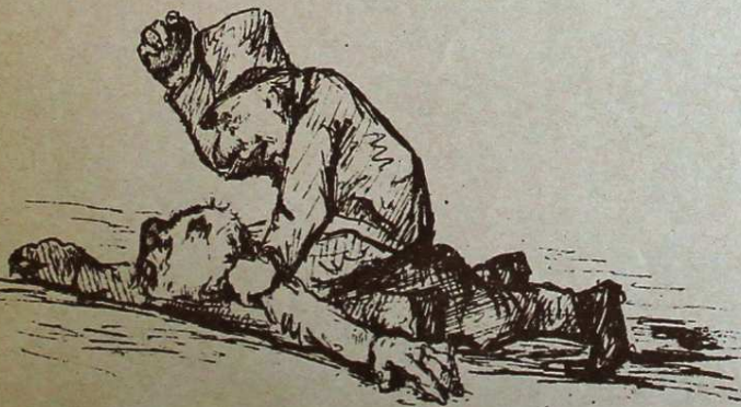
Med en vig rörelse sätter man sig öfver hans rygg, fattar en sten och slår honom i hufvudet.