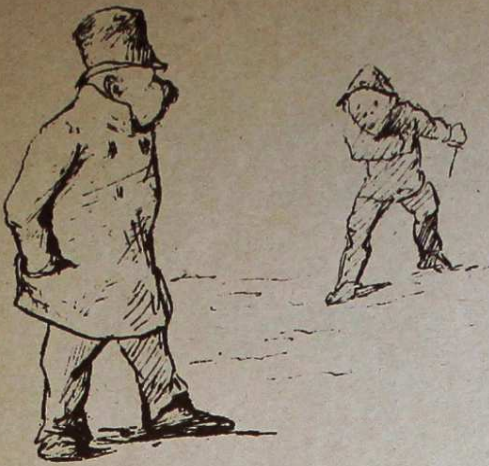
Man upptäcker bofven på afstånd