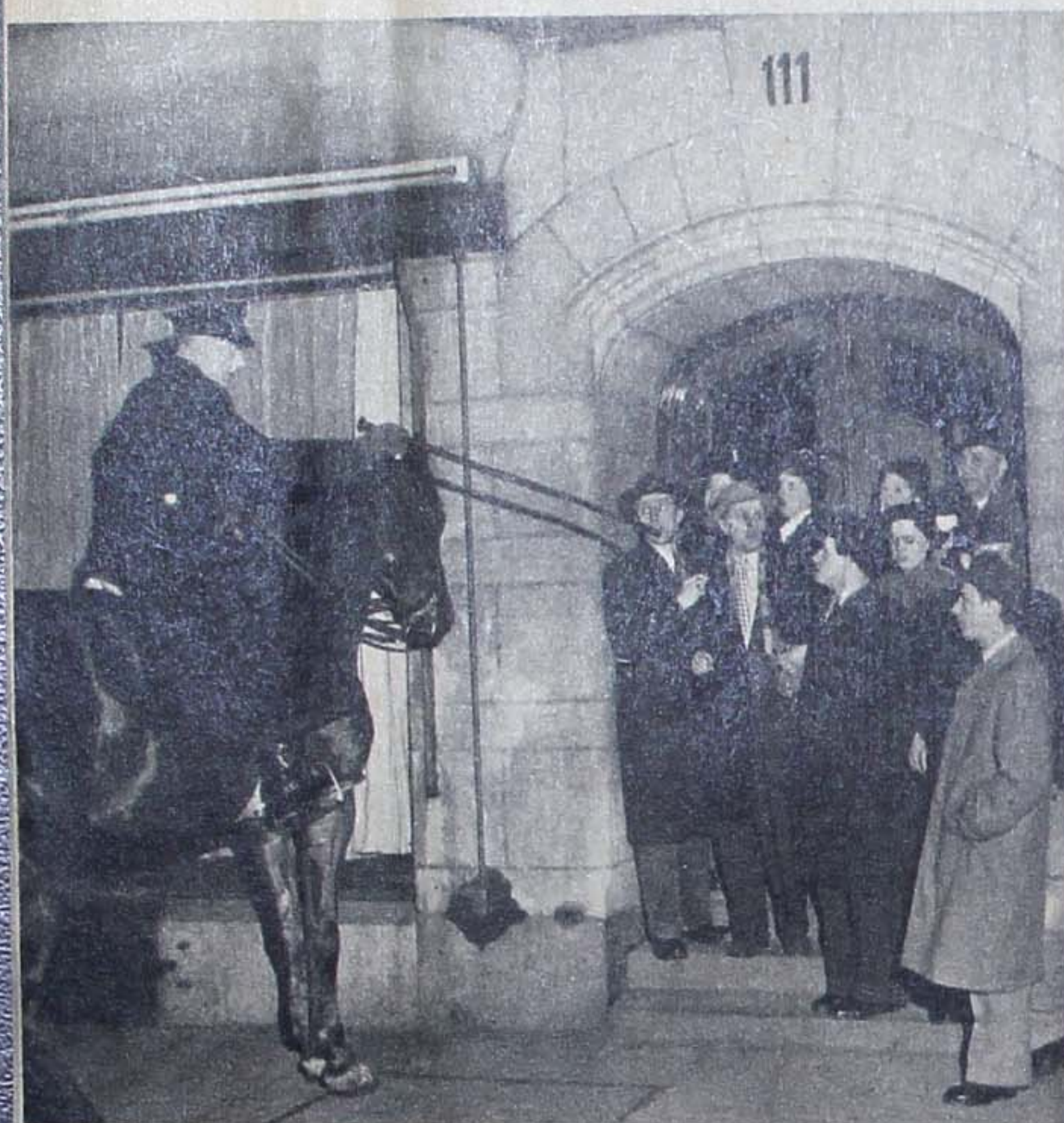
Kravet på ordning botar inte oordningens orsaker...

...god fritidssysselsättning ger resultat.