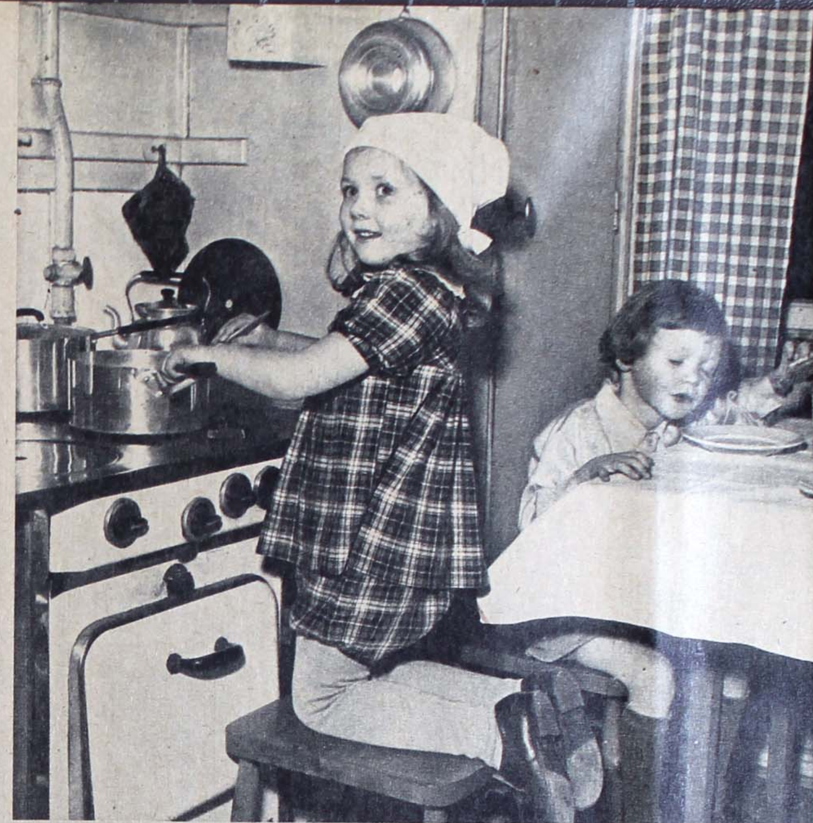
Miljön avgör barnens framtid.

Sympatiserar Du med vår ideella grundsyn? Anser Du att verkliga försök att förena frihet och trygghet i samhällslivet bör göras? Önskar Du en sådan maktfördelning mellan de politiska riktningarna att samverkan och hänsyn tryggas? I så fall stöder Du Folkpartiet och Frisinnade Medborgarföreningen.