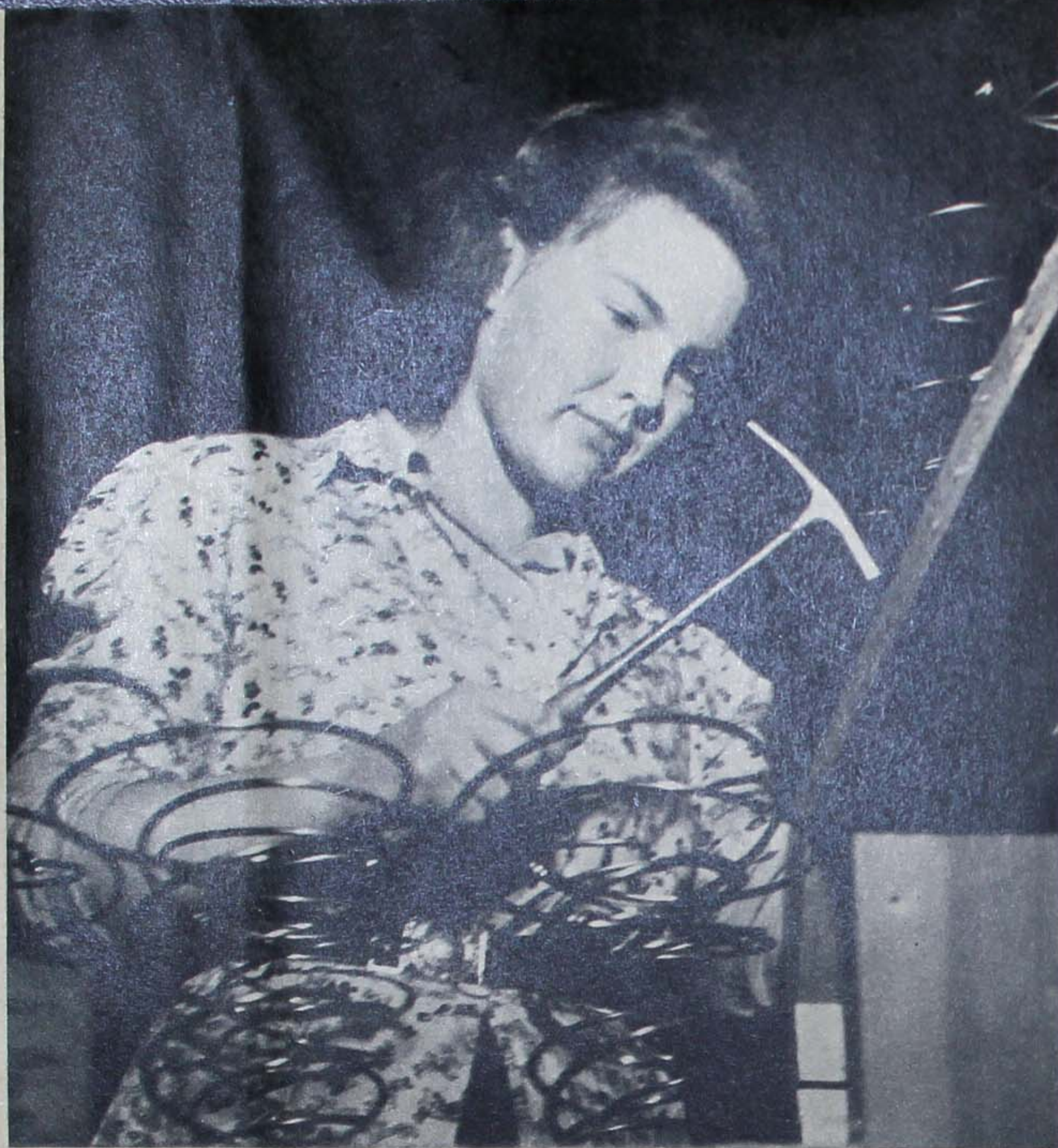
Arbetet kan bli en glädje om utbildningen är den rätta.