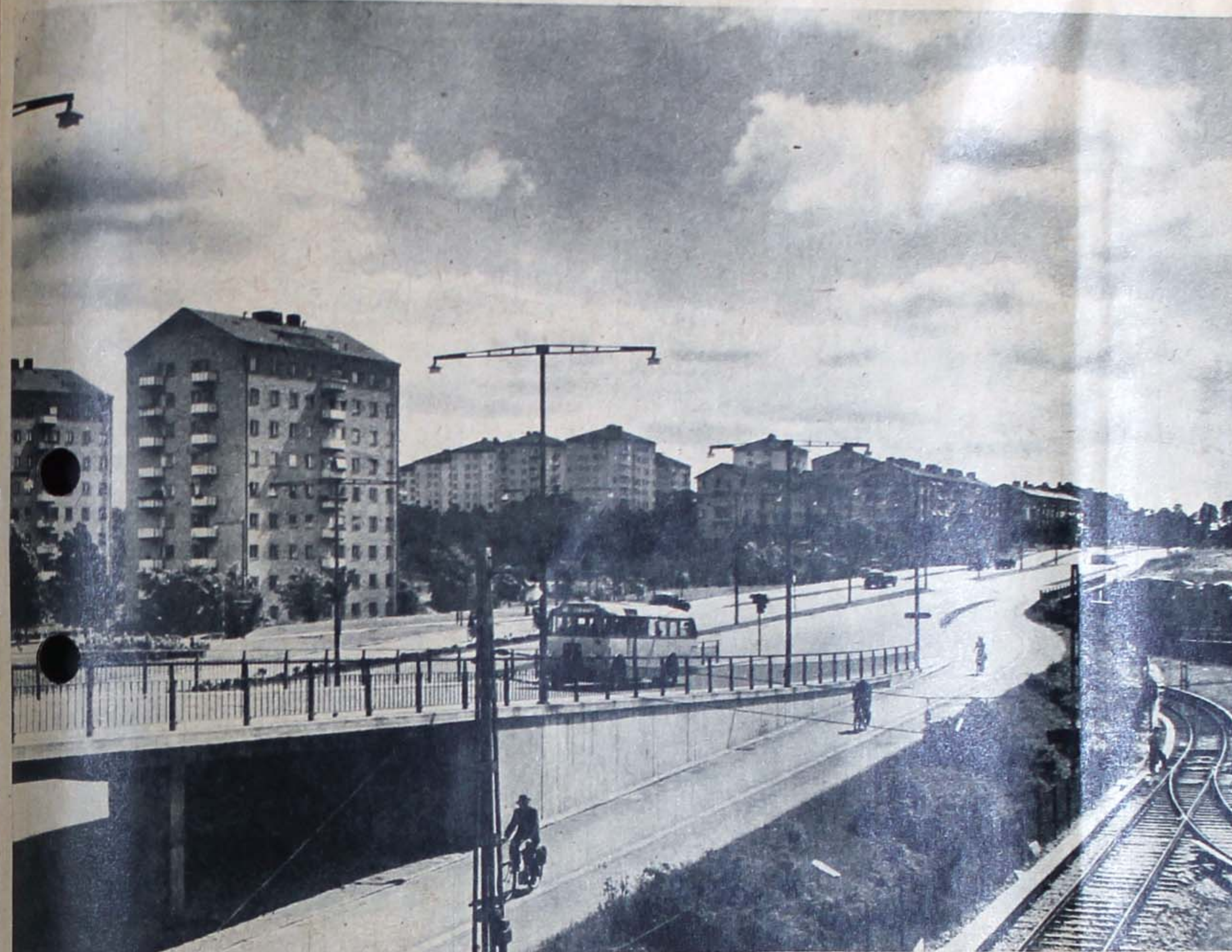
Johanneshov är hjärtpunkten för all trafik till Enskede.

Det är heller inte utan att man känner en allmän oro för de gröna stråken när man ser hur det kapas av en bit här och där på plättar som redan från början tagits till alltför knappa. Församlingshuset med vad det innebär hälsar man naturligtvis med glädje. Men det vore skada att därför spoliera ett betydande parkområde. Vågar man hoppas på en lösning som tillgodoser båda synpunkterna?