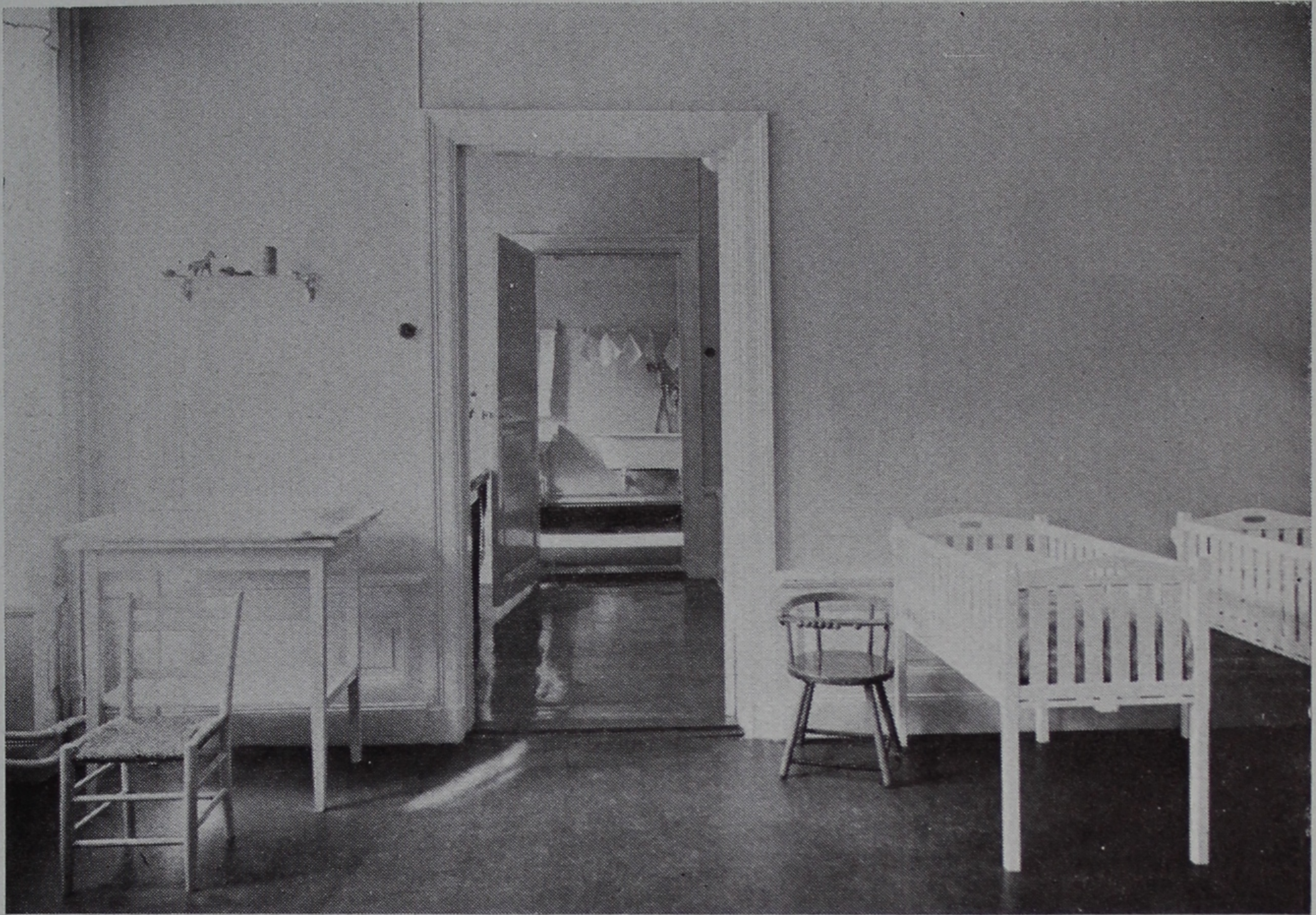
Spädbarnens sovrums samt badrum – det senare sett genom mat- o. strykrummet