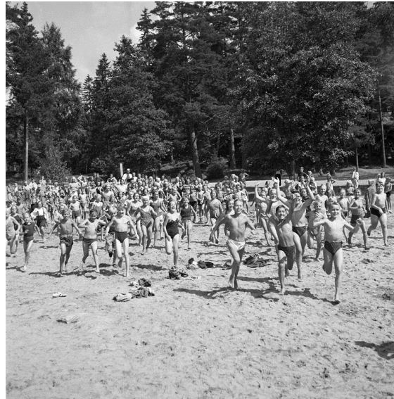
Badsugna barn på Flatenbadet, 1944.

Under 1940-talet gavs det ut en skoltidning som hette Vi och vår skola vid Riksby folkskola. Folkskola motsvarade det som heter grundskola idag, och det var eleverna själva som skrev artiklarna. I Stockholmskällan kan du finna bland annat 1946 års utgåva. Vad kan en skoltidning säga om dåtidens skola, barn, ungdom och samhälle?