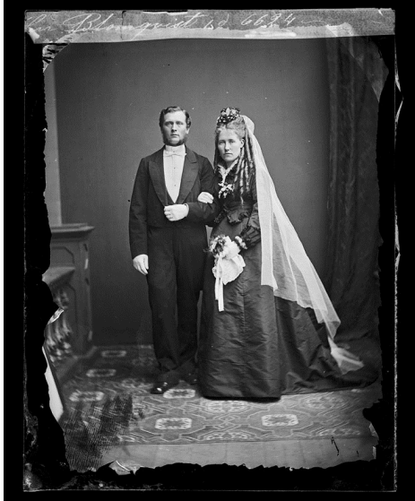
Kärlek eller ett sätt att komma upp sig? Brudparet Blomqvist, 1864-77.