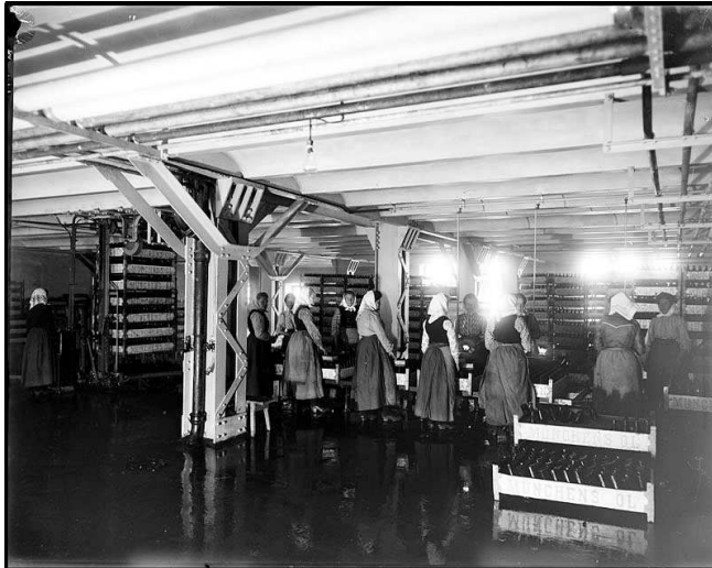
Bryggeriarbeterskor, 1901.