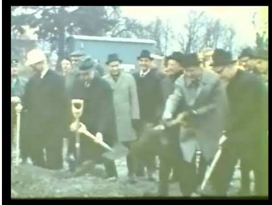
Första spadtagen tas till det moderna Akalla.