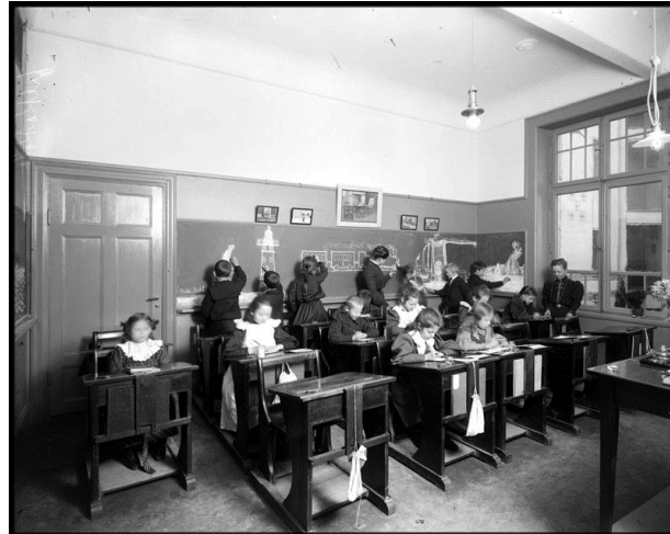
Interiör från folkskola, 1912.