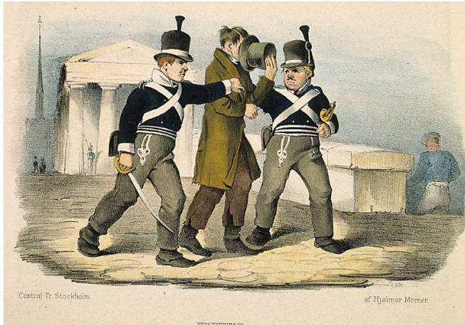
Korvar av Hjalmar Mörner, 1815-37. Stadsvakterna kallades ofta "korvar" på 1800-talet.