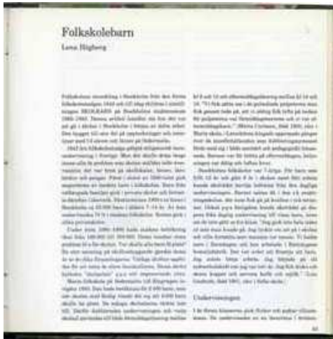
Artikel om folkskolan av Lena Högberg, 1983.