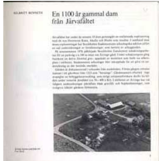
Artikel av Solbritt Benneth, 1978.

1976 hittade arkeologer en grav i närheten av Ärvinge gård. I graven låg en kvinna begravd. Hon hade varit ovanligt lång för sin tid, cirka 170 cm, och blivit ovanligt gammal, 50-65 år. De som begravde henne hade lagt ned olika saker i graven; bland annat en sjal runt axlarna, en kruka med mat och olika smycken. Kvinnan hade levt på 800-talet efter vår tideräkning, det vi ofta kallar vikingatiden. Men vad kan vi egentligen lära oss om livet för 1100 år sedan genom att studera en gammal grav?