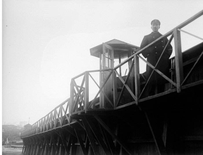
Vakt utanför en vaktkur på muren runt Långholmens fängelse, 1910-talet.

När en fånge släpptes fri från Centralfängelset på Långholmen runt sekelskiftet 1900 fyllde fängelset i ett formulär om fången. Formulären innehåller uppgifter om vilket brott fången hade blivit dömd för och hur långt straffet blev. Dessutom innehåller de ett foto på fången och födelsedatum, hårfärg och andra kännetecken, och hur mycket pengar fången tjänat ihop under tiden i fängelset.