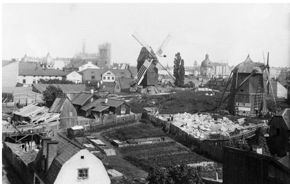
Tegnérlundens, 1870-90.

Fördjupning: Jämför novellerna med andra kärleksskildringar, nutida eller andra samtida som finns i Stockholmskällan.