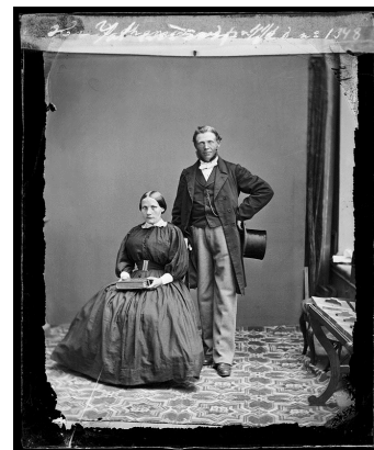
Ett gift par, 1864-77.