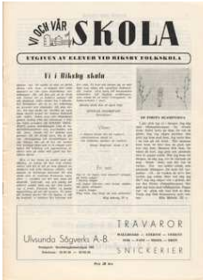
Tidningen Vi och vår skola , 1946.