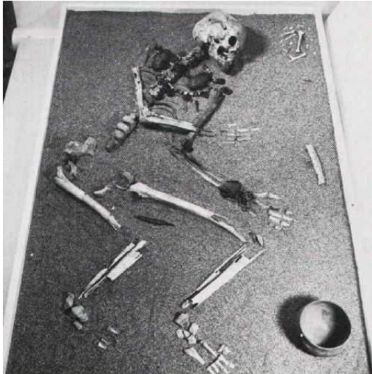
Rekonstruktion av 800-talsgrav.