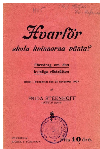
"Hvarför skola kvinnorna vänta?" Föredrag av Frida Stéenhoff, 1905.