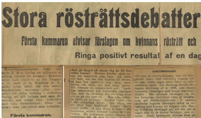
Stora rösträttsdebatter i riksdagen, 1912. Referat av debatten, Stockholms dagblad, 19 maj 1912.