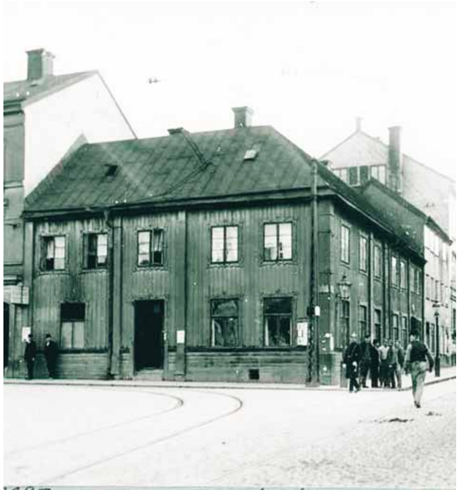
INNEKROG. I Källaren Hamburg, hörnet Götgatan/nuvarande Folkungagatan, fick sig även de dödsdömda en sista sup. Bilden är från 1908.

LÄS MER OM DET GAMLA STOCKHOLM PÅ STOCKHOLMSKÄLLAN - WWW.STOCKHOLMSKÄLLAN.SE