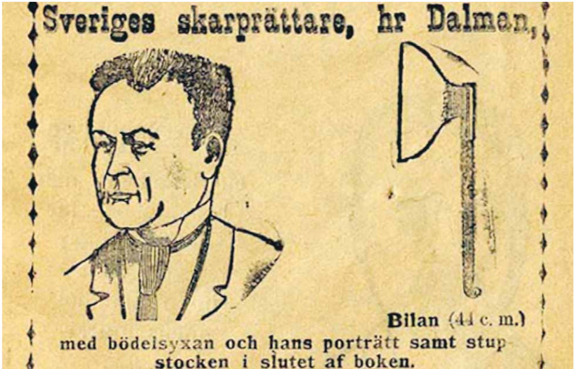
VARNING. Från framsidan av en skrift från 1900 kallad "En bok till varning för dem som gå fria. Vaktkonstaplars och fängelsedirektörers berättelser om lifvet på Långholmen".